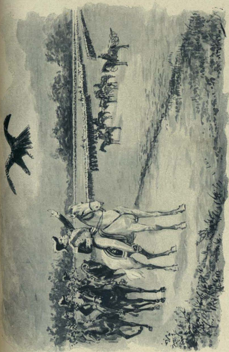
En la revista de anteayer, una gran águila descendió sobre las tropas...

En Chilpancingo esperaba á S. A. S. el recibimiento más suntuoso; pero ninguna comparación tuvo con lo que ocurrió poco después. En la revista de anteayer, una gran águila descendió sobre las tropas, se paró precisamente frente á Santa Anna, confirmando esto la misión que tiene recibida el General; pues sólo de él se deja coger el águila, y sólo con él se muestra mansa y humilde, al paso