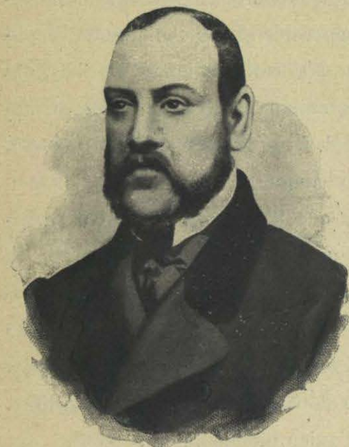
D. IGNACIO COMONFORT

Se previno primero á Villarreal que marchara á Mé-