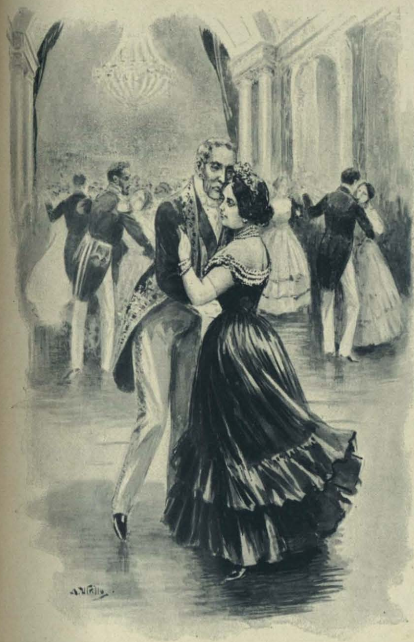
S. A. S. la señora Presidenta lo bailó...

Los salones eran una maravilla de gusto, de elegancia