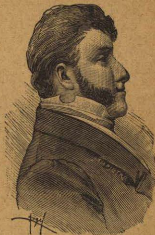
D. AGUSTÍN DE ITURBIDE Consecutor de la independencia. † fusilado el 19 de Julio de 1824

¿Qué mexicano ilustre no se adhirió a la revolución de Hidalgo?