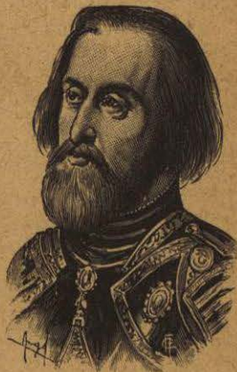
HERNÁN CORTÉS Conquistador de México Nació en 1485, † en 1574

Hernán Cortés, que después de haber tocado la isla de Cozumel y costeadado la península de Yucatán, penetró en el río de Tabasco, ganó una batalla a los naturales y fundó la ciudad de Santa María de la Victoria, donde se celebró por vez primera en tierra firme del continente americano el sacrificio de