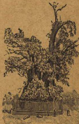
ÁRBOL DE LA NOCHE TRISTE (La del 30 de Junio de 1520)

¿Quién sostuvo el sitio de México y cómo terminó éste?