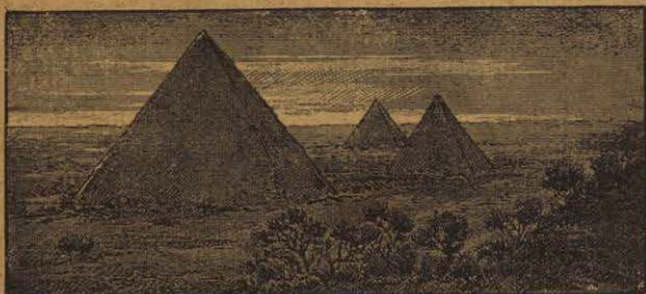
PIRÁMIDES DE SAN JUAN DE TEOTIHUACÁN Obra de los toltecas en una de sus ciudades santas

En el Estado de Chihuahua se hallan las ruinas de Casas Grandes; en el de México se alzan las pirámides de Teotihuacán; en el de Puebla, la de Cholula; en Chiapas se admiran los templos de Palenque; en Yucatán los antiquísimos edificios de Uxmal y de Chichén Itzá. En Oaxaca llaman la atención los palacios de Mitla; en Tabasco, el palacio y torre de Comalcalco, etc., etc.