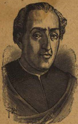
CRISTÓBAL COLÓN descubridor de América † en 1506

¿Quién proporcionó a Colón los elementos necesarios para ese descubrimiento?