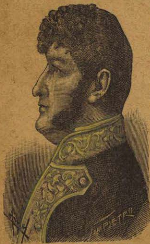
D. IGNACIO ALLENDE

¿Dónde fué nombrado el cura de Dolores capitán general?