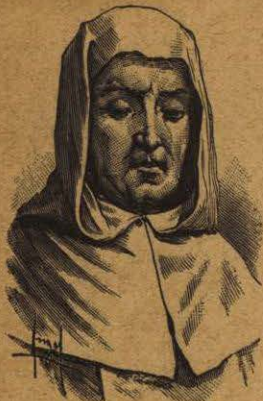
FRAY BARTOLOMÉ DE OLMEDO

¿Cuándo llegaron los conquistadores a México?