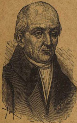
D. MIGUEL HIDALGO Y COSTILLA Primer caudillo de la Independencia

Es el verdadero autor de la idea de la independencia. Nació en 1779 en San Miguel el Grande. Siguió la carrera militar, y obtuvo el grado de capitán de Dragones. Amante de la independencia, organizó una Junta en Querétaro para procurar la realización de su idea.