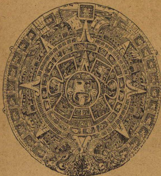
LA PIEDRA DEL SOL (CALENDARIO AZTECA) Representa una distribución del tiempo, hecha con admirable ingenio

tes, y fué fundada la ciudad de Chichén-Itzá. Por el año 551 de nuestra era fué fundada Uxmal, ciudad que fué el santuario del arte maya. Por el año 1420,