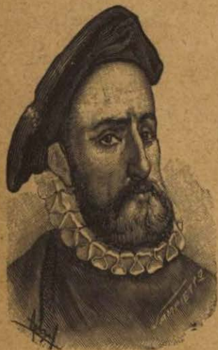
D. LUIS DE VELASCO Segundo virrey de Nueva España

— Don Antonio de Mendoza, primer virrey, mejoró la condición de los indios; estableció la imprenta en México, siendo ésta la primera ciudad de América en que la hubo; fundó el Colegio de Santa Cruz Tlal-teolco para la educación de indios nobles, el cual plantel produjo multitud de varones indios ilustres en la ciencia y en la virtud, y fundó las ciudades de Guadalajara, Valladolid y Zacatecas.