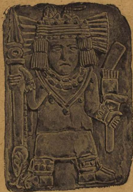
HUITZILOPOCHTLI Dios de los aztecas

Itzcoatl, que hizo la independencia del reino; Moctezuma Ilhuicamina, quinto rey, que con el carácter de general en jefe de los mexicanos derrotó a Maxtla, y que como soberano llevó sus armas hasta el mar por Oriente; Ahuizotl, que conquistó Tehuantepec y Soconusco, y construyó y dedicó el templo mayor, y Cuauh-témoc, último rey azteca.