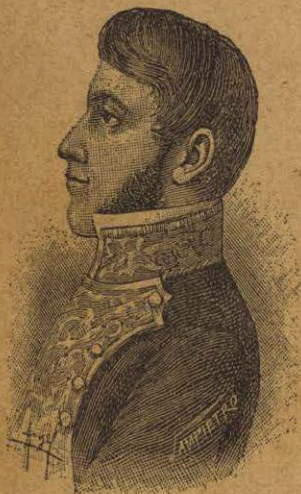
D. JUAN ALDAMA

¿Qué hicieron después los caudillos de la revolución?