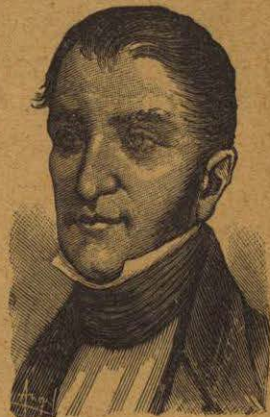
D. NICOLÁS BRAVO

La llegada de D. Francisco Javier Mina, español que vino a luchar por la independencia de México.