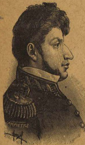
D. VICENTE GUERRERO

D. Agustín de Iturbide. ¿Por qué le llamáis ilustre? Porque fué el libertador de México.