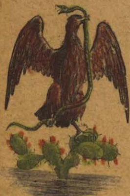
ÁGUILA SOBRE UN NOPAL. Señal prometida a los aztecas para fundar Tenochtitlán

El 18 de Julio de 1325. Por el valle de México continuaban vagando los aztecas desde su llegada a Zumpango, hasta que por fin vieron ese día, en unos islotes del lago de Texcoco, un águila sobre un nopal, misterioso signo que su dios Huitzilopochtli les había señalado como término de su marcha. Allí hicieron alto los fatigados mexicanos y pusieron los cimientos de su ciudad, a la que dieron el nombre de Tenochtitlán.