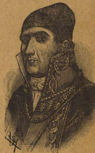
D. JOSÉ MARÍA MORELOS

¿Cuál fué el hecho de armas más glorioso de Morelos?