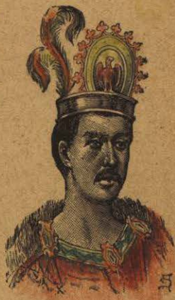
MOCTEZUMA Emperador de México a la llegada de Cortés

Tonalá era la capital del señorío independiente de Tonallán . Su última reina fué Tzoalpilli.