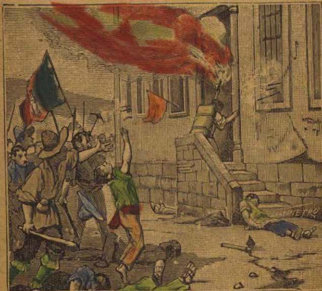
...se aproximó hasta la puerta del castillo...

El día 28 de Septiembre. Hidalgo, al frente de 25.000 hombres, se presentó a las puertas de Guanajuato e intimó la rendición al intendente Riaño, que con todos los españoles se había hecho fuerte en el castillo de Granaditas. No habiendo querido rendirse, comenzó el