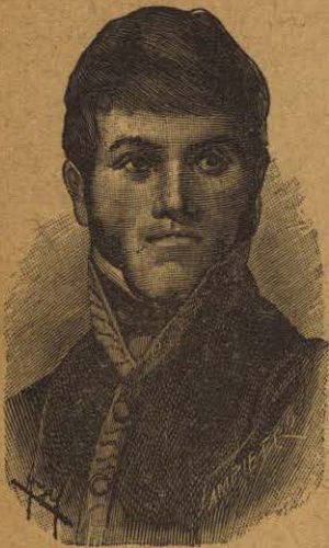
D. FRANCISCO-JAVIER MINA

— Con 320 hombres que reunió en Soto la Marina se puso en marcha para el interior, tomando a los realistas 700 caballos. De triunfo en triunfo caminó hasta llegar a León, ciudad que intentó tomar; pero fué rechazado, y se retiró al fuerte del Sombrero, donde se había fortificado el insurgente D. Pedro Moreno, que con 600 hombres resistió por varios meses un sitio formal, derrotando a los españoles en varios encuentros. Sin víveres los sitiados, Mina hizo una salida para proporcionárselos, pero fué dos veces derrotado.