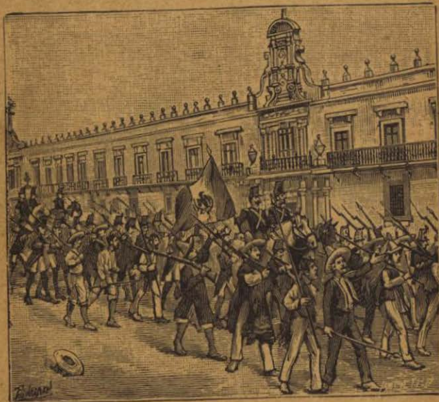
Destile del ejército independiente

A principios de 1821, Guerrero era el único jefe insurgente que quedaba sobre las armas en las montañas del Sur. El virrey Apodaca envió a Iturbide con un escogido cuerpo de tropas a batir al jefe suriano.