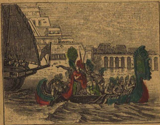
PRISIÓN DE CUAUHTÉMOC

Poco después Cortés hizo una expedición a Pánuco para someter a los huastecas; envió a Gonzalo de Sandoval a conquistar a Tuxtepec, y encomendó al capitán Orozco la conquista de Oaxaca.