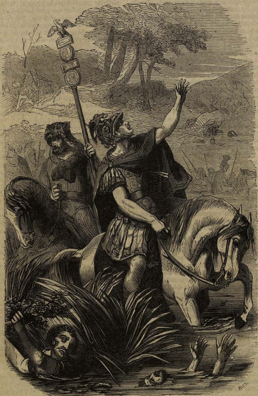
MUERTE DE DECIO.

El emperador no habia comunicado su ardor á los soldados, y su vigor para mantener la disciplina le habia enajenado el amor de las legiones. Puso sitio á Aquilea, y los habitantes se defendieron, llegando