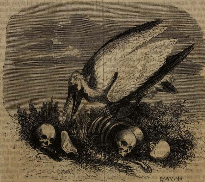
PELICANO EN UN CEMENTERIO INDIO.

Pasa en seguida el autor á examinar el problema de las ideas innatas . Sin adoptar la opinion que las desecha, ni colocarse entre los que las adoptan, cree que Dios ha dado á los hombres colectivamente , pero no al hombre en particular , cierta cantidad de principios ó sentimientos innatos (como la revelacion del Ser Supremo, la inmortalidad del alma, las primeras nociones de la moral, etc.), absolutamente necesarios para el establecimiento del orden social. De aquí deduce que en rigor puede encontrarse un hombre aislado que absolutamente carezca de noticia de esos