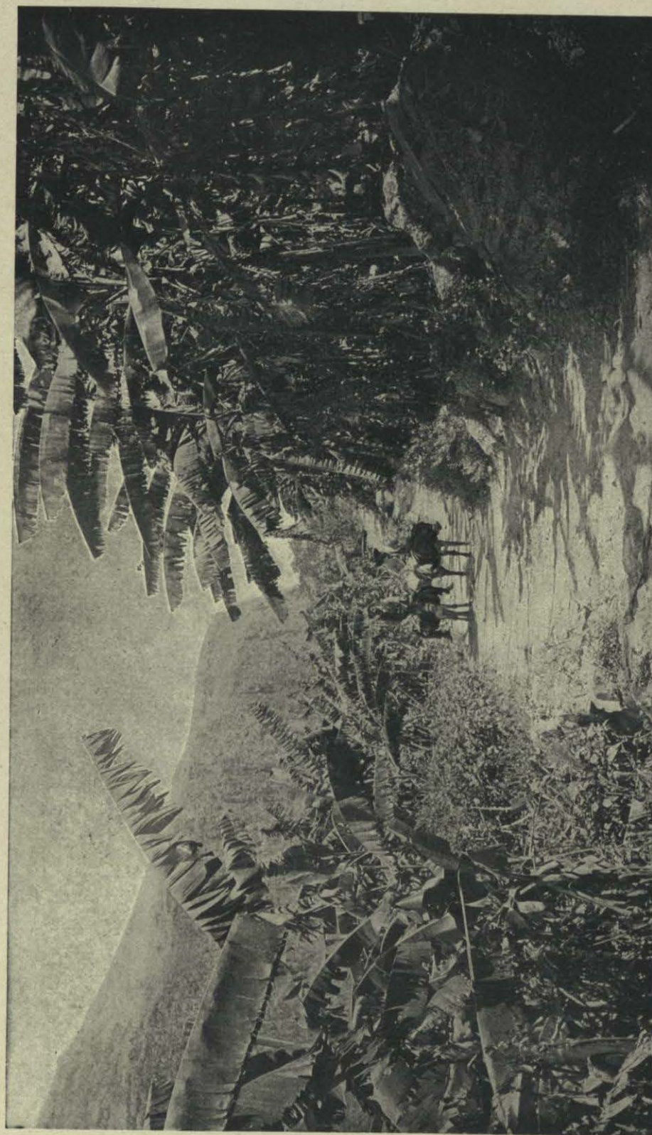
BOSQUE DE BANANEROS EN NUEVA GRANADA