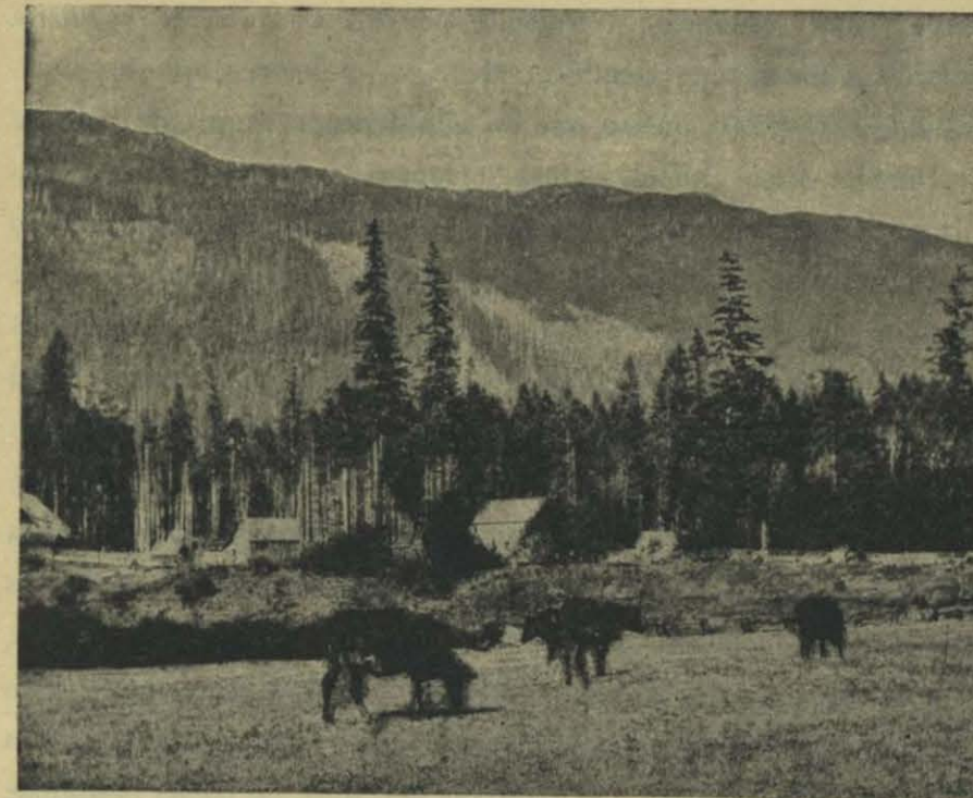
GRANJA ESTABLECIDA Á EXPENSAS DEL BOSQUE. COLOMBIA BRITÁNICA

En conjunto los hombres han trabajado sin método en el arreglo de la Tierra. Conocían qué parte del suelo convenía á sus cultivos y la escogían juiciosamente, pero ¡ con qué barbarie procedían á la preparación del terreno! Todavía en los Estados Unidos, en el Canadá y en el Brasil los roturadores de la agricultura comienzan su