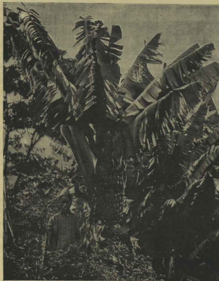
EL BANANERO Y SU RÉGIMEN

muerta, hace tres siglos. En aquella época, en efecto, no se encuentra huella alguna del reparto periódico de las tierras, como en el mir actual, lo que ha permitido á Tchicherin y á Fustel de Coulanges emitir la hipótesis que la misma propiedad colectiva fué de