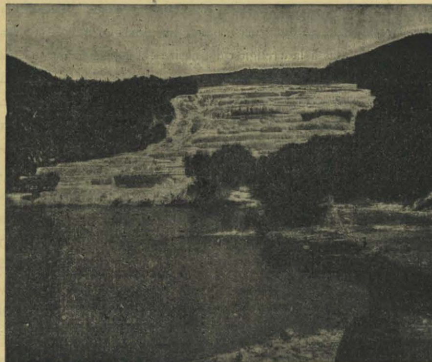
NUEVA ZELANDA — MANANTIAL INCRUSTANTE DE ROTOMAHANA

ñanza cristiana se acomodaba perfectamente á animar á los delatores. Además el conjunto de su código estaba impregnado de un espíritu de codicia financiera; la multa más ó menos fuerte era la única pena pronunciada para todos los delitos ó crímenes, á excepción de las rebeldías políticas, que se castigaban con el destierro. La pobre literatura kanaca no comprende más libros que la Biblia, cantos religiosos, trataditos de escuela y, para uso de los niños, un «guía