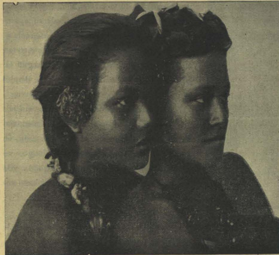
Cl. del Globus .

objetos de vidrio para reemplazar sus monedas de piedra tallada, ágatas ó jaspes, agujereadas, emplearon su tiempo en no hacer nada y se envilecieron y depravaron 1 . Ya en este caso no es extraño que hubiera negreros que propusieran el trabajo forzado como remedio á esa holganza de los indígenas, y, sin más escrúpulos, algunos aventureros americanos se han entregado durante los últimos