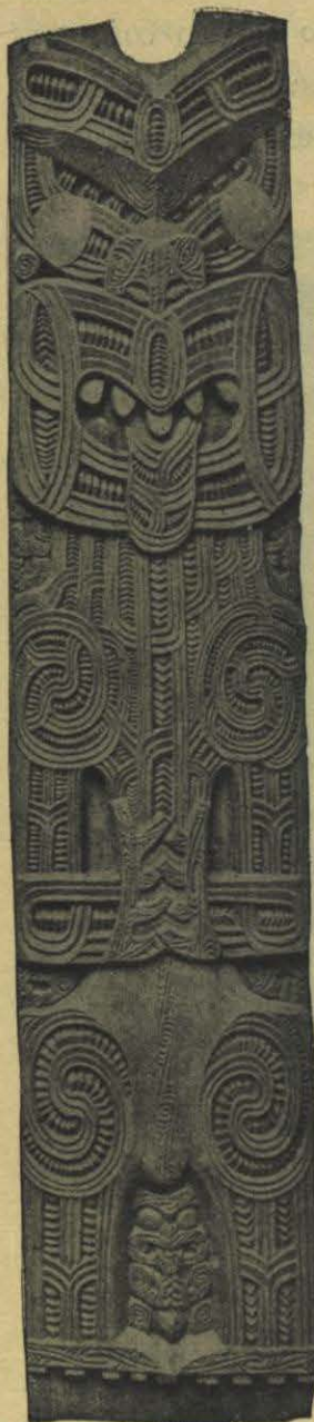
VIGA DE UNA CASA Escultura maori.

las tribus aventuradas fuera de su medio, ó sometidas al asalto de