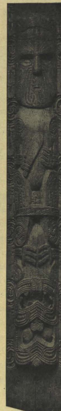
VIGA DE UNA CASA Escultura maori.

La facilidad y frecuencia de los viajes, que colocaron estas islas en la proximidad virtual del mundo europeo, tendrán por consecuencia indirecta la modificación de la raza. Las islas del Pacífico tropical parecen hechas para ser mansiones de felicidad: son paraísos más encantadores que los palmerales, ya muy bellos, de las márgenes del Eufrates y que los jardines de la Armenia, dominados de lejos por el doble cono del Ararat. Es seguro que la admirable «vía láctea» que miriadas de islas han formado en el mar del Sur, será, en un porvenir bastante próximo, una sucesión de retiros deliciosos donde irán á descansar por un tiempo ó á reposar toda la vida aquellos á quienes fatiga la ruda lucha industrial de nuestras grandes ciudades. Allá se suceden al infinito «costas de azur», no menos propensas al reposo que la «corniche» de Menton y la «costa» de Génova. Ya unos ingleses de Nueva Zelanda fletan barcos de vapor para ir á centenares á visitar de etapa en etapa los sitios más curiosos de aquel vasto mundo insular del Pacífico y, entre los visitantes, los hay que se quedan en el camino,