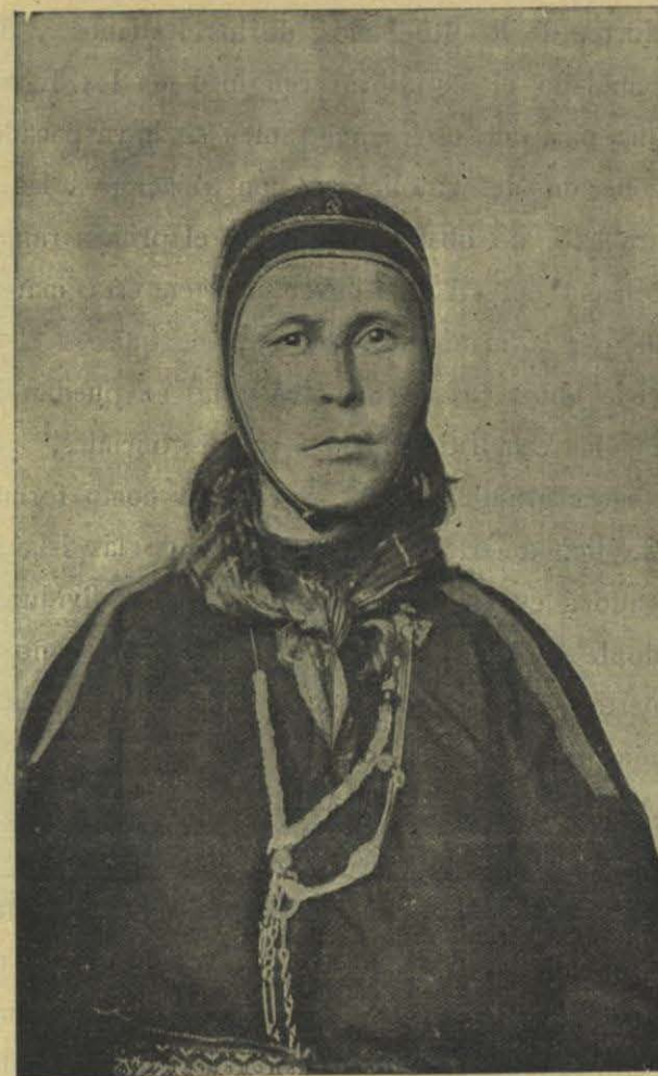
LAPONA DE RUSIA RECIÉN LLEGADA Á LOS ESTADOS UNIDOS

herencia, resulta de la legislación que entre los Americanos es de regla una profesión de fe cristiana, por vaga ó contradictoria que sea. La iniciativa que el ciudadano suele aportar ordinariamente á su trabajo y su género de vida le permite cambiar de secta, inscribiéndose sucesivamente en veinte iglesias diferentes, pero no se comprendería que no se uniera á una iglesia cristiana de una manera cualquiera, aunque sea bajo una forma verbal ó simbólica. En una familia de muchos hijos suelen contarse tantas religiones como