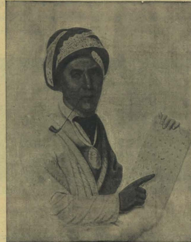
SEQUIAH (SEQUOIA), INDIO TCHEROKI

Norte se procuran la mano de obra lo más barata posible, es decir, se esfuerzan en hacer trabajar al negro de la comarca mediante los simples gastos de su manutención, escatimados al último extremo: es en verdad la esclavitud sin la obligación de mantener á los niños ni á los ancianos. Se recurre, pues, á las complacientes le-