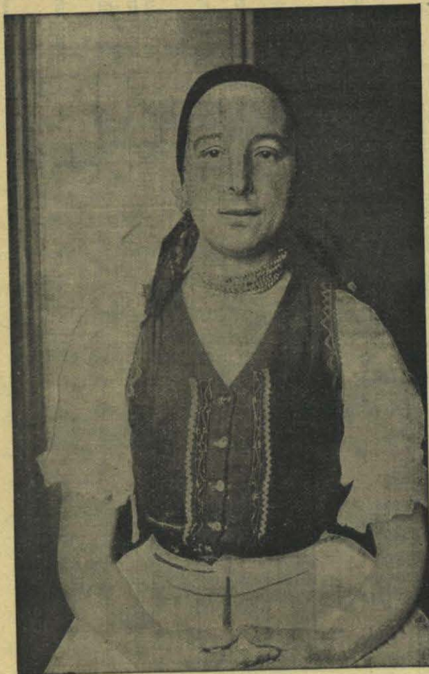
HÚNGARA RECIÉN LLEGADA Á LOS ESTADOS UNIDOS

agotamiento; en ninguna parte hay más solteras que renuncien al matrimonio ni más mujeres que eviten la maternidad. La población se renueva felizmente por inmigraciones continuas: tras los Ingleses han venido los Irlandeses, después los Canadienses franceses que han afrancesado ya el norte del Maine (Shaler, Boutmy, etc.). Á