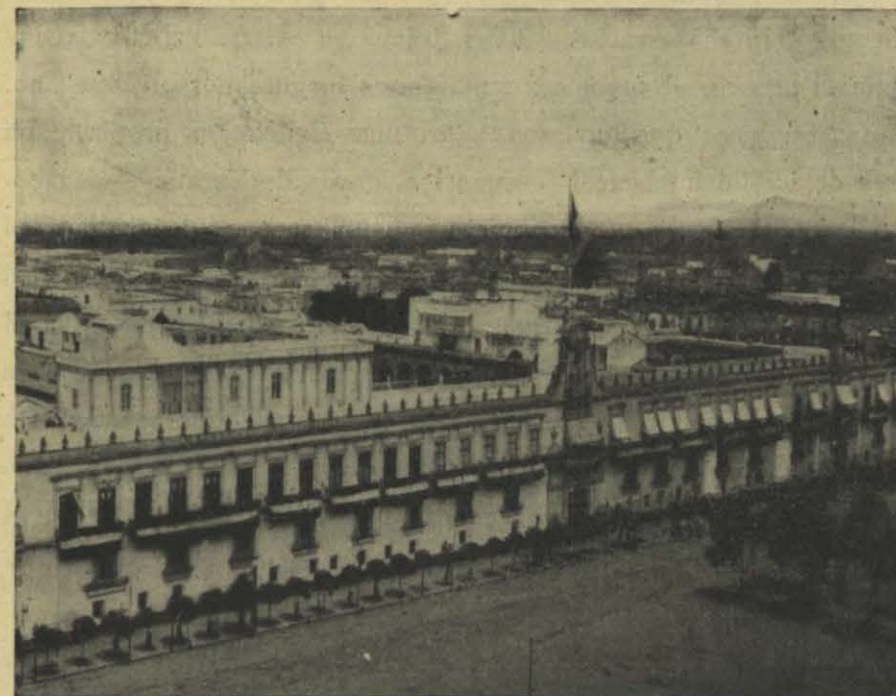
CIUDAD DE MÉJICO: EL PALACIO

mejicana. En la infinita complicación de las cosas, sucede que la lucha de dos elementos opuestos termina por la realización de un estado superior en que cada uno ha obtenido la victoria. Ciertamente los Gachupinos odiados, es decir, los Españoles, han hecho prevalecer sus tendencias republicanas, su modo de civilización, su ascendiente moral, en tanto que los Indios prevalecen en la estructura misma de la nación, constituyendo su carne y su sangre.