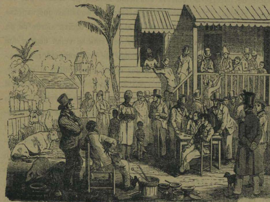
Cl. P. Sellier.

La Iglesia, en la mayoría de sus pastores, se había regimentado sólidamente; era preciso también domesticar la ciencia, y ésta se prestó