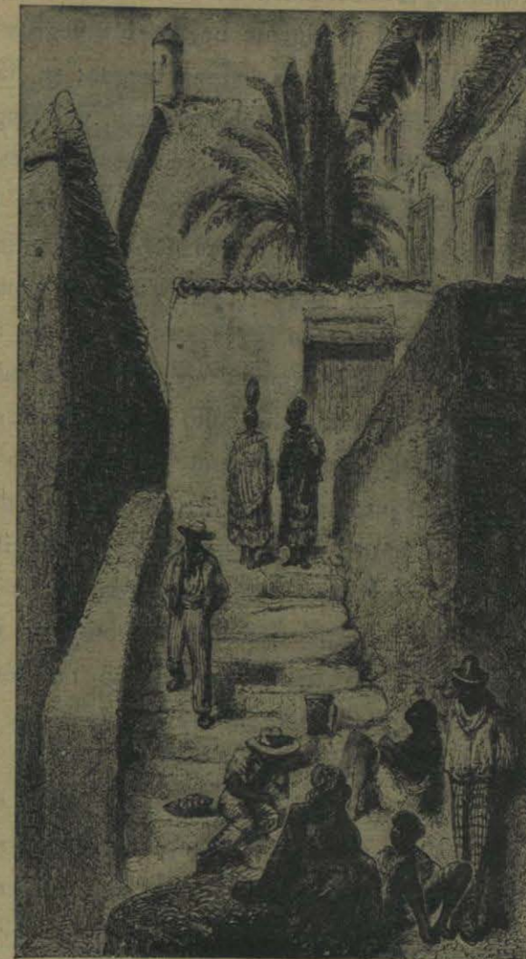
Cl. P. Sellier.

A la mitad del siglo XIX, los descendientes de los aborígenes eran mucho menos numerosos en proporción de otro elemento étnico, los nietos de los Africanos importados durante los dos siglos precedentes por los mercaderes de esclavos. En 1860, en vísperas de la guerra civil que había de estallar entre las dos mitades de la república norteamericana, se contaban cerca de cuatro millones de negros y mestizos en los Estados Unidos, es decir, más de diez veces el número de los antiguos propietarios de la tierra. Las cuatro quintas partes de la gente de color eran esclavos, y se comprende que ese ganado humano no haya podido ejercer influencia directa alguna sobre la nación ambiente compuesta de blancos, Europeos de origen; pero los mismos negros libres se hallaban completamente fuera de la sociedad de los ciudadanos de raza pálida, sea por su condición de baja clientela y de pobreza, sea por la repugnancia instintiva y más aún religiosa sentida contra «los hijos de Cham». Hallábanse, por decirlo así, perdidos en el espacio, puesto que quedaban «tabús» en su país de residencia y que el rapto brutal que sufrieron sus antepasados había roto el lazo que les unía á su patria de origen. ¿De qué parte de Africa habían venido sus padres ó