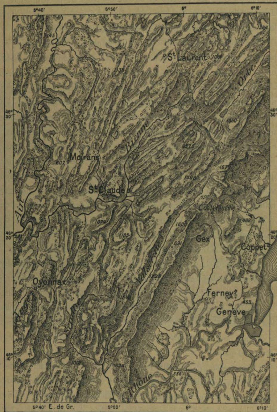
N.º 427. Saint-Claude y Ferney.