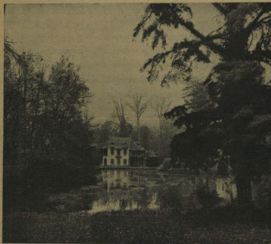
EL PEQUEÑO TRIANÓN, DONDE MARÍA ANTONIETA JUGABA Á LA CAMPESINA

para creerse verdaderamente el amo. «La esencia y la vida del gobierno, dice Michelet, eran las disposiciones arbitrarias». Hasta cuando el rey no lo era más que de nombre, después de la toma de la Bastilla, en Febrero de 1790, todavía conservaba su privilegio de hacer encerrar á quien quisiera 1 .