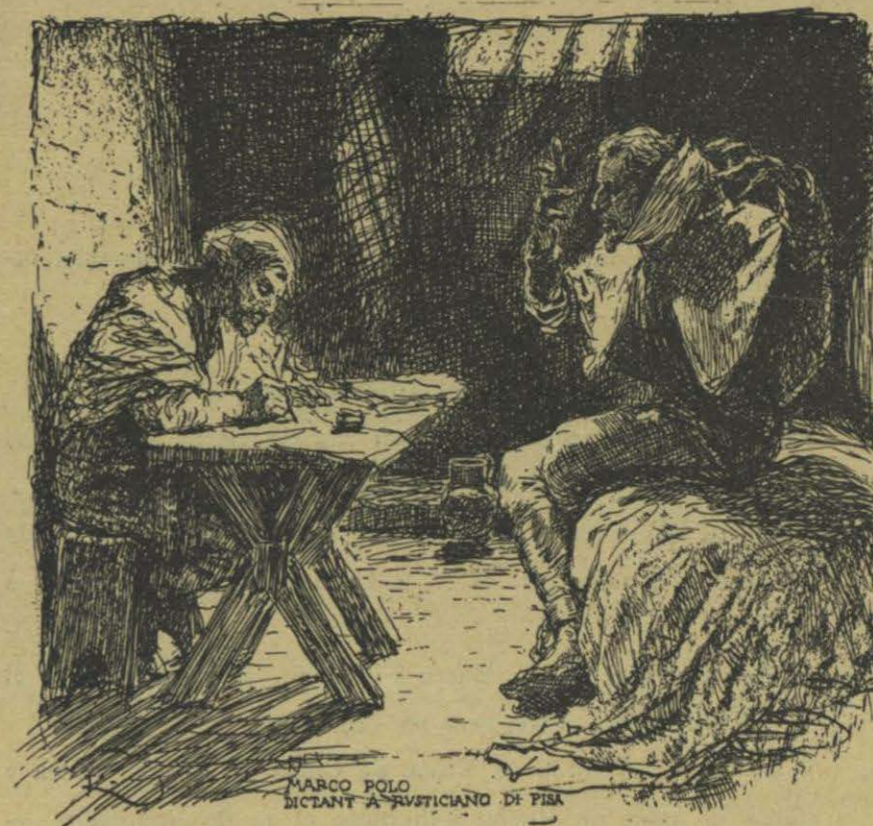
MARCO POLO DICTANT A RUSTICANO DI PISA

guerrero musulmán. Hasta los nombres griegos tomaron un aspecto bárbaro: la ciudad por excelencia Eis την πόλιν fué designada bajo el nombre de Stambul, y la media luna de Artemis y de Hécate que adornaba los edificios de Bizancio, llegó á ser, contra la «cruz» de Roma, el símbolo mismo de la guerra santa musulmana.