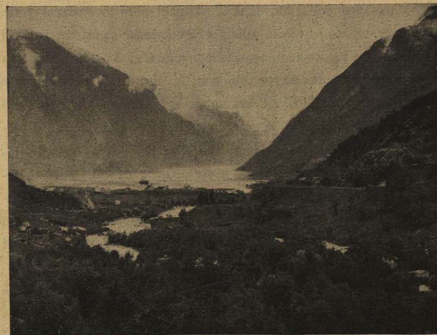
VALLE NORUEGO AL EXTREMO DE UN FJORD

época. El gran respeto que á pesar de todo se tenía por la ciencia y por todos los «portadores de luz», sea que representaban el saber antiguo, sea que fuesen ya los precursores de una religión nueva, como los frailes irlandeses que llevaron á los montañeses de los Alpes las primeras nociones del cristianismo, ese respeto fué uno de los grandes agentes de la transformación gradual de las ideas