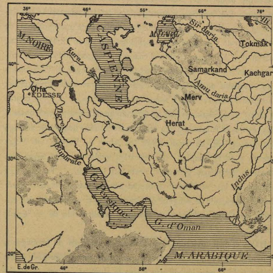
N.º 280. Centros de propaganda nestoriana.

saba de monstruosa herejía porque distinguía las dos naturalezas, divina y humana, de Jesucristo, y no reconocía á la Virgen María el nombre de «Madre de Dios». Perseguidos duramente por sus correli-