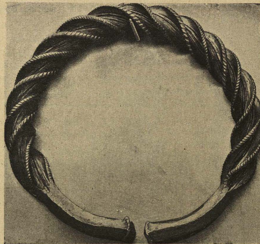
Museo de Cluny.

antigua Siberia donde se hallan galerías mineras y las tumbas: también se aplicaba el mismo nombre a las tribus de Europa que han dejado huellas de su estancia, sin que se conozcan sus descen-