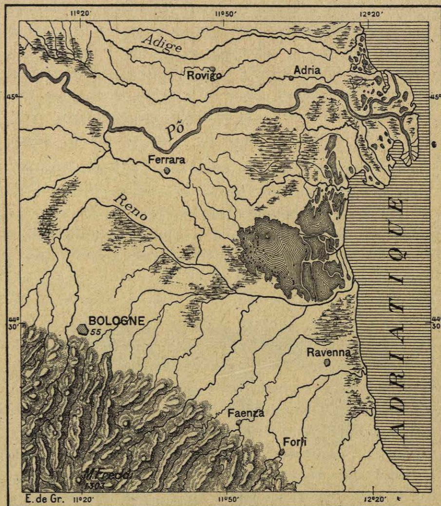
N.º 262. Rávena y sus inmediaciones.

truyendo la civilización local y poniendo el Africa para siglos fuera de la historia 1 .