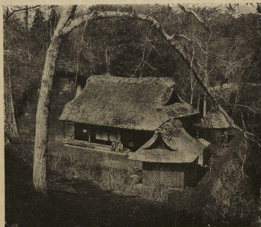
CASA DE CAMPO EN YOKOHAMA

origen. Primeramente los Yamatos, a los que se considera como los Japonezes por excelencia y que tenían en otro tiempo por territorio exclusivo todo el litoral del Pacífico, desde la bahía de Yedo hasta la punta meridional de Kiu-siu: ellos fueron los que acabaron por predominar sobre todos los otros continentes, y su lengua, fuertemente asociada al Chino, ha llegado a ser la de todo el archipiélago.