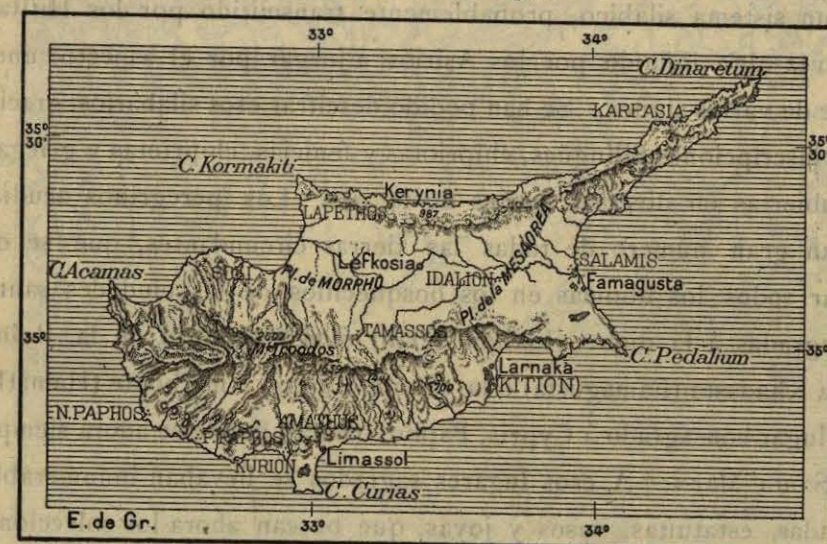
N.º 175. Isla de Chipre.

ques eran, con los trigos, los aceites y el vino, las riquezas ambicionadas por los conquistadores de Fenicia, de Asiria ó de Egipto. Según la leyenda, los Chipriotas serían, como los Chalybes del Asia Menor, inventores del trabajo metalúrgico: su héroe nacional, Kyniras, fabricó las primeras herramientas de la forja, el yunque, las tenazas y el martillo; fué el primero que trabajó la coraza de Agamenón y