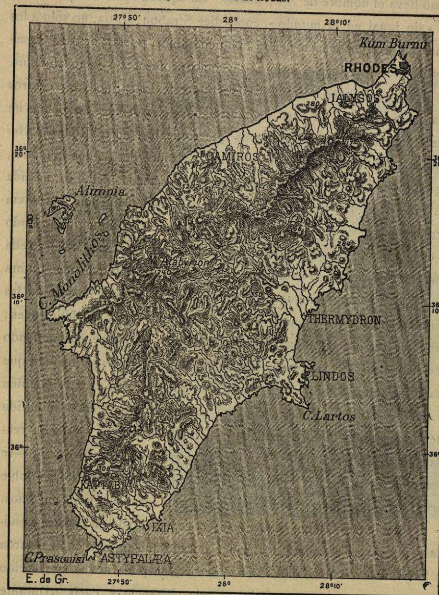
N.º 174. Isla de Rodas.

Cuando la gran extensión del mundo helénico coincidía con la división del imperio de Alejandro en varios reinos griegos, Rodas, tan bien situada en el centro de los mares, llegó á ser el foco principal del comercio, y, gracias á su enriquecimiento, una potencia política de gran importancia con numerosas posesiones en tierra firme y en las islas. Rodas dispuso de tan grande influencia, durante dos siglos al menos, que sus leyes marítimas fueron aceptadas por todos