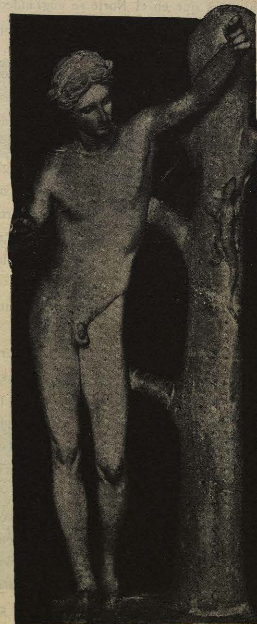
Museo del Louvre.

Pronto comenzó de nuevo la lucha entre Esparta y Atica, después la peste, aportada por los barcos de Egipto, diezmo las poblaciones de la Grecia del Norte. Las «metabolias» ó transformaciones, que se suceden en la historia interior de Atenas 2 , guerras, revoluciones y contra-revoluciones, expediciones desastrosas, tiranías