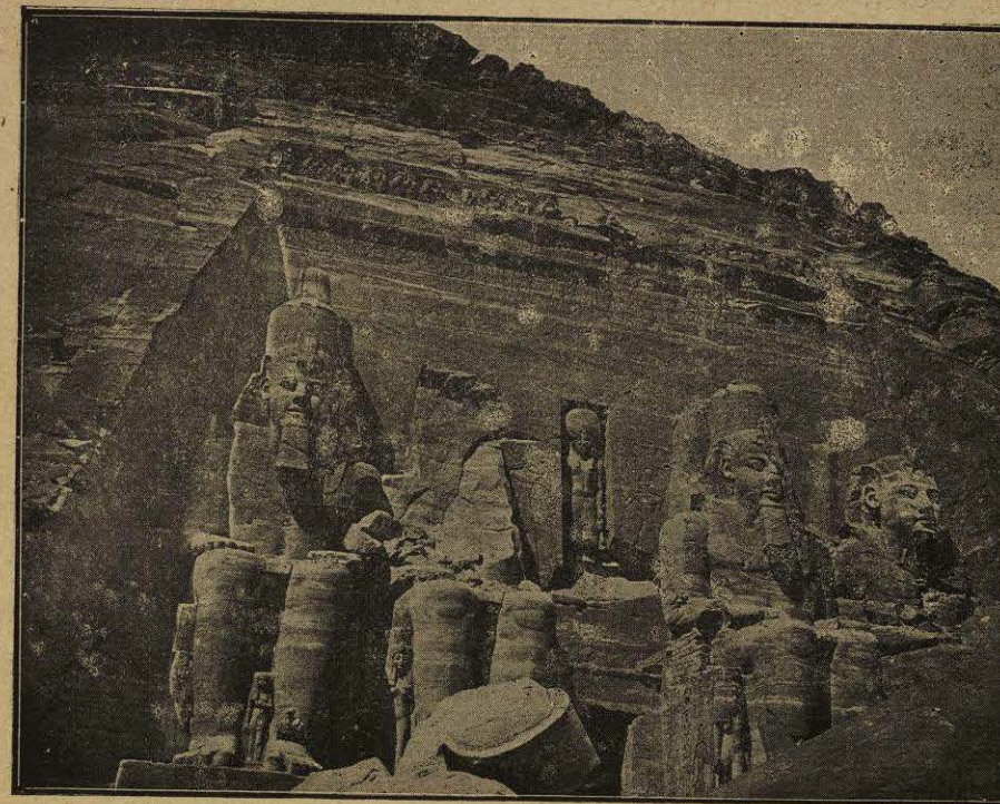
ESTATUAS COLOSALES DE SESOSTRIS EN IBSAMBUL

La dominación de los Faraones de Egipto solía detenerse á corta distancia al otro lado de las cataratas llamadas «primeras» á causa de su proximidad al bajo valle, pero sucedió que unos reyes poderosos hicieron penetrar sus soldados al lado opuesto de los desiertos hasta la «península» á las tierras fértiles entre el Nilo y el Atbâra. Las primeras huellas de conquista egipcia en ese territorio de Meroé datan de unos cinco mil años, puesto que entre los restos esparcidos en medio de las ruinas, se han encontrado trozos de piedra que llevan la marca del rey Usertesen I, de la duodécima