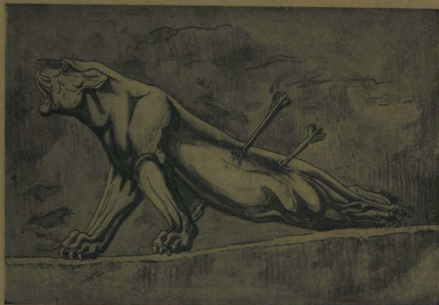
LA LEONA HERIDA

Ocurre preguntar si no ha de atribuirse á la costumbre de derramar sangre, de atormentar y de matar, la superioridad incontestable de los artistas asirios en la representación de los hombres y de los animales moribundos; la obra maestra del arte ninivita es la leona herida que se defiende todavía con las fauces y las patas delanteras, mientras que la parte trasera del cuerpo, ya paralizada, se arrastra estirada sobre el suelo.