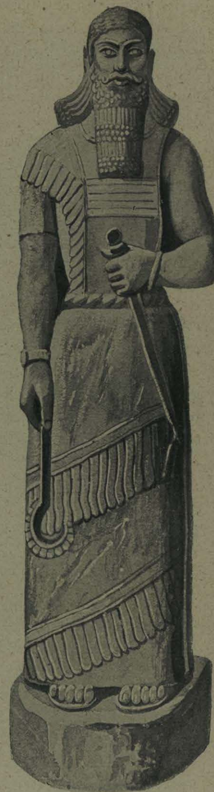
ESTATUA DEL REY ASSUR-BAN-I-PAL (Museo Británico).