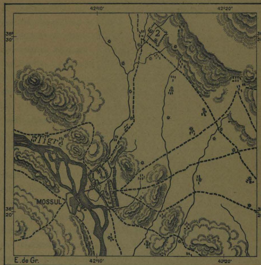
N.º 95. Nínive y Khorsabad.

guido por los enemigos, acababa de aceptar el mando de los Griegos y tomaba las primeras disposiciones para su famosa retirada, no se hallase bien dispuesto á discurrir sobre la gloria de la antigua Asiria y las ironías del destino.