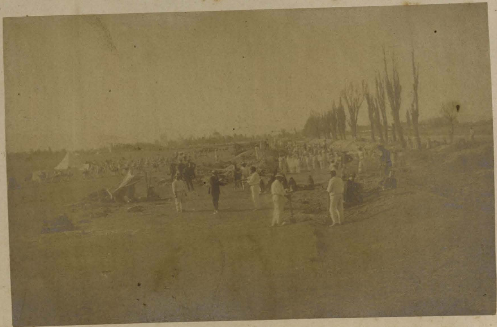
Nuevo Canal de México a Chalco.