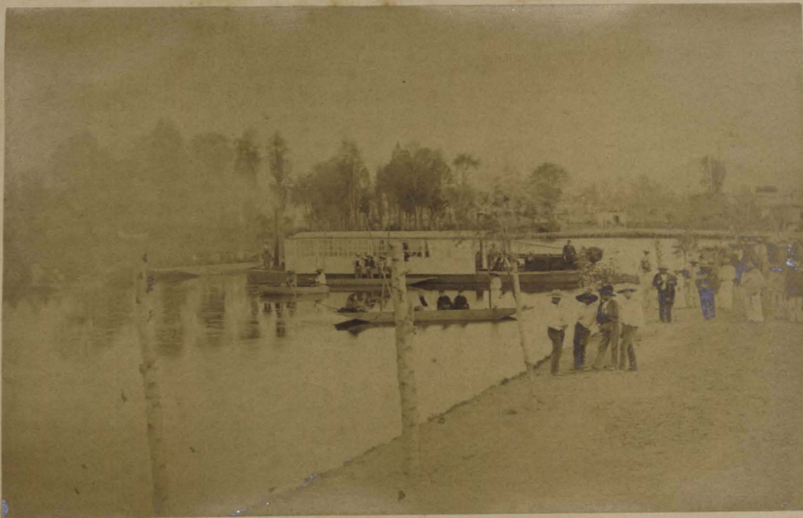
Nuevo Canal de México a Chalco.