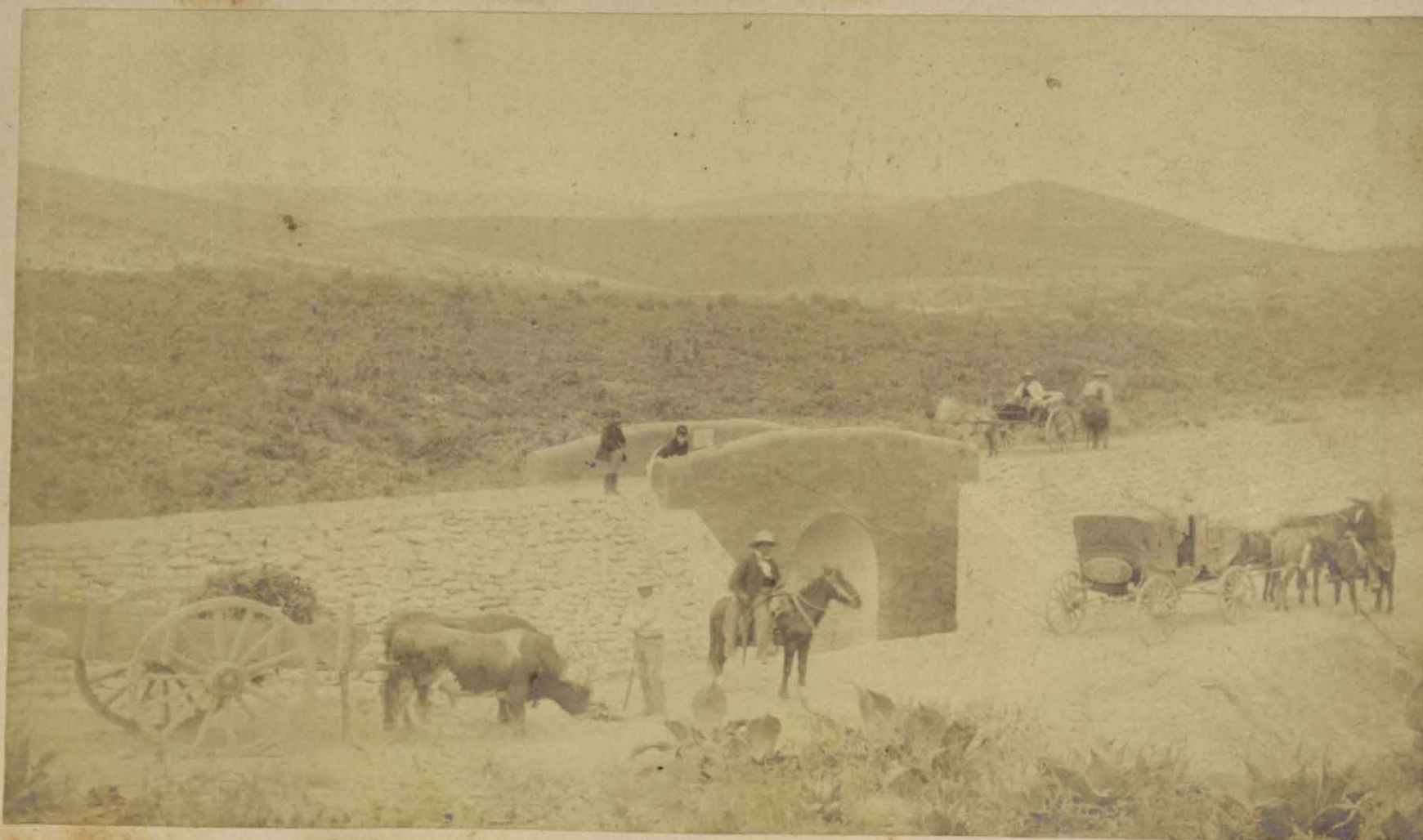
Obras del Ferrocarril de Tehuacan a la Esperanza.