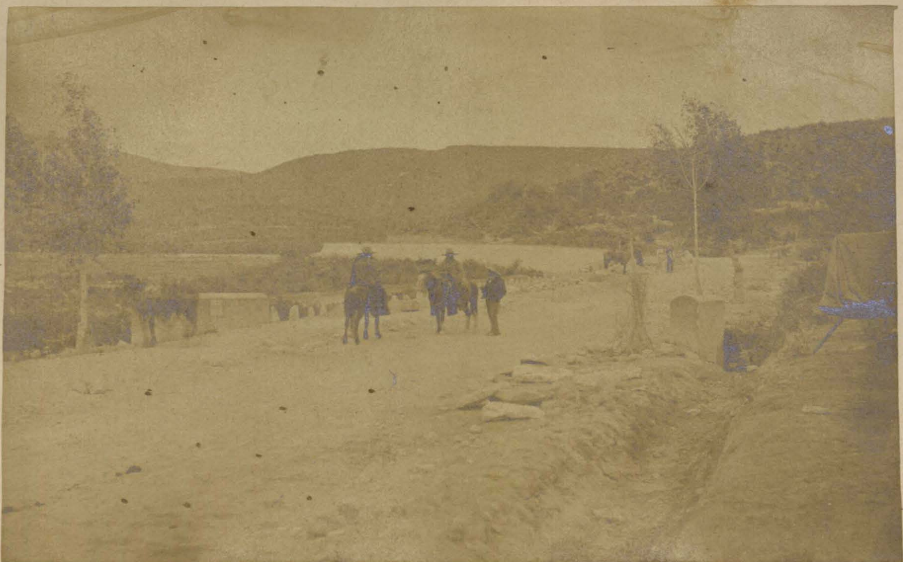
Obras del Ferrocarril de Tehuacan a La Esperanza.