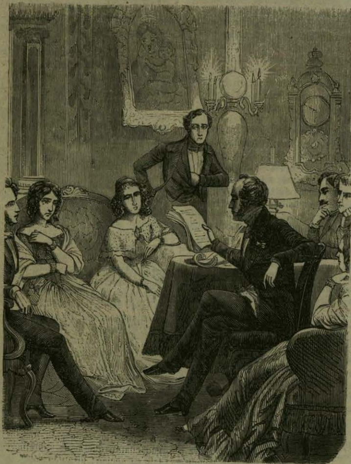
CHATEAUBRIAND EN CASA DE MDE. DE RECAMIER.

Ese pobre desprovisto de ciencia, y de quien nadie se ocupará jamás, ha ejercido por la sola doctrina de sus virtudes sobre sus compatriotas de padecimiento la influencia divina, que emanaba de las virtudes de Jesucristo. El libro mas hermoso de la tierra