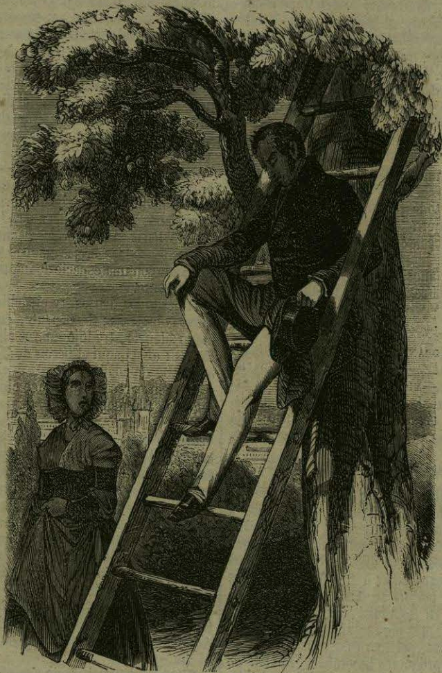
LA ESCALERA Y LA ALDEANA.

A las diez de la noche paso por delante de Butschirad, en la campiña muda, vivamente iluminada por la luna. Diviso la masa confusa de la quinta, de la aldea y de la ruina en que habita el delfin: la demás