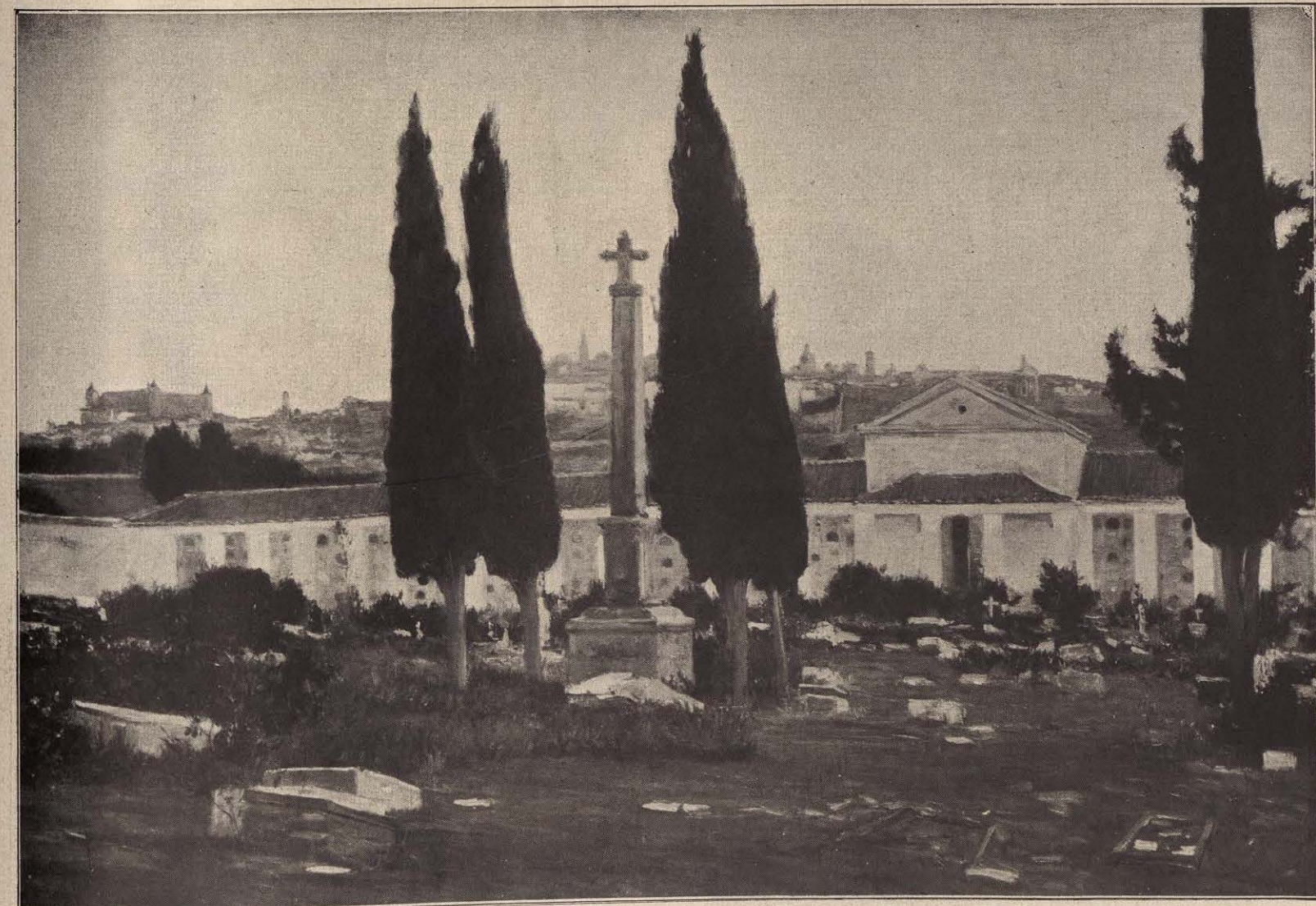
EL CEMENTERIO VIEJO — AURELIANO DE BERUETE.