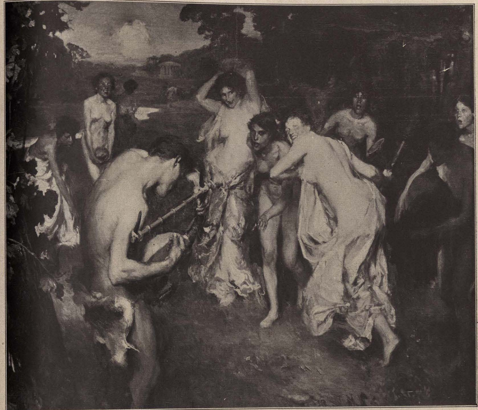
ORFEO PERSEGUIDO POR LAS BACANTES — F. ALVAREZ DE SOTOMAYOR.