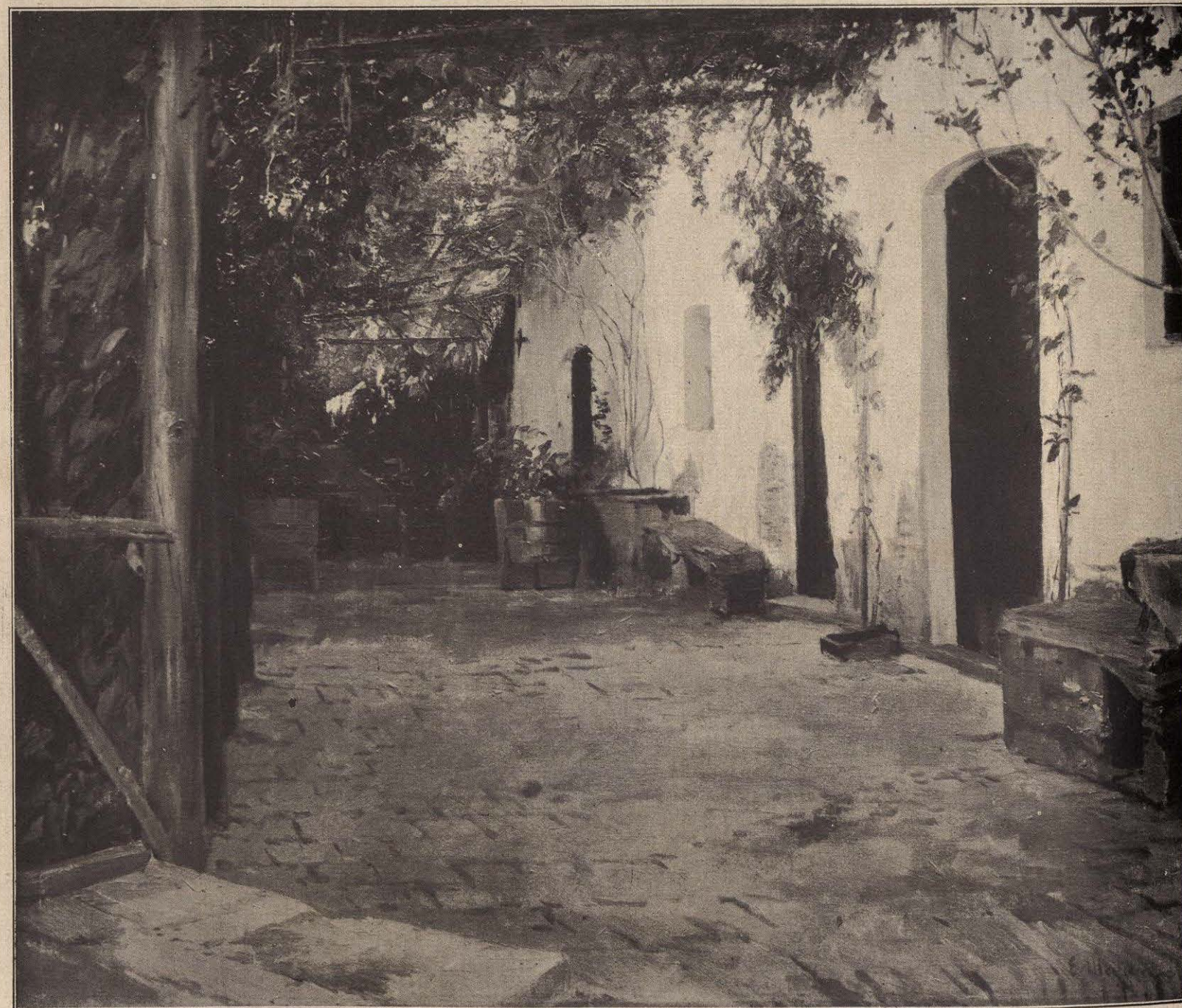
CASA CHICHI (VALLVIDRERA). — ELÍSEO MEIFRÉN.