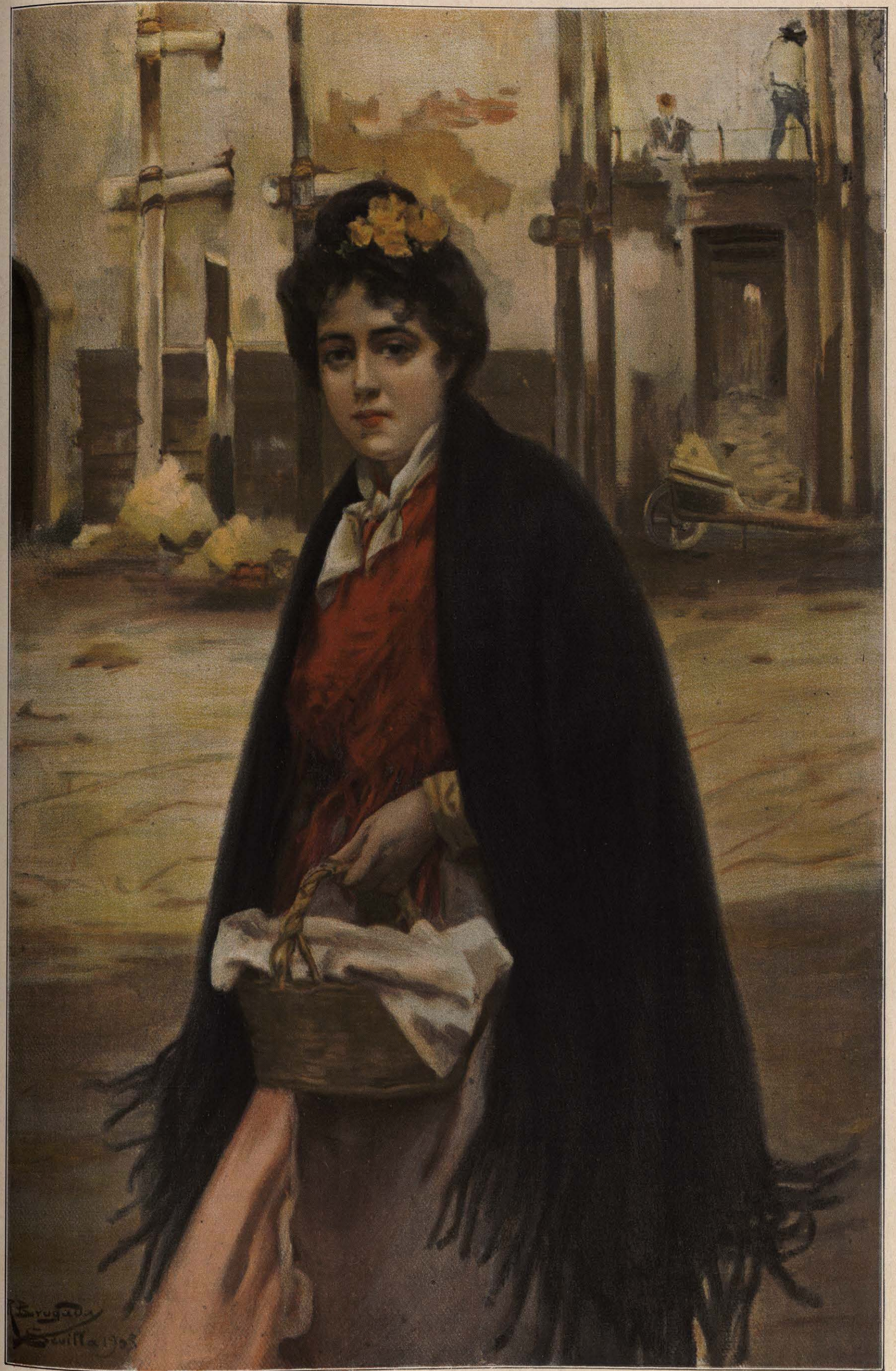
Cuadro de RICARDO BRUGADA.