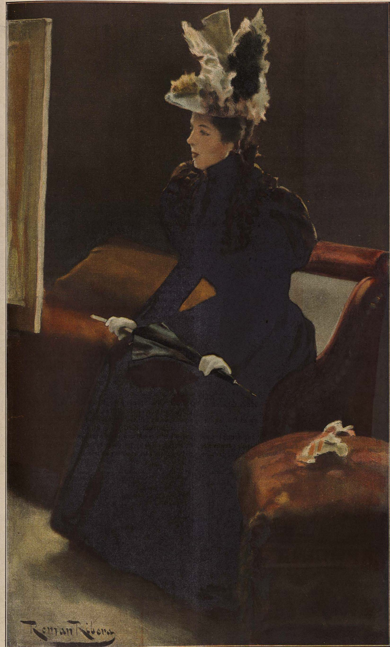
Cuadro de ROMÁN RIBERA.