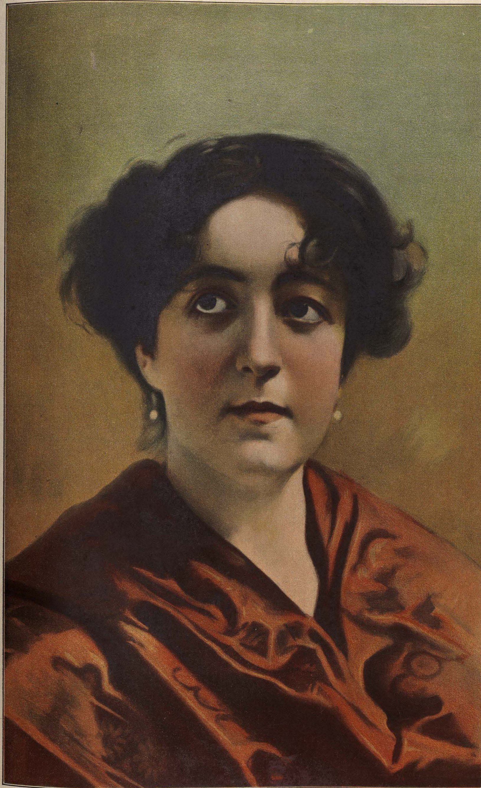
Cabeza de estudio; por PABLO BÉJAR.