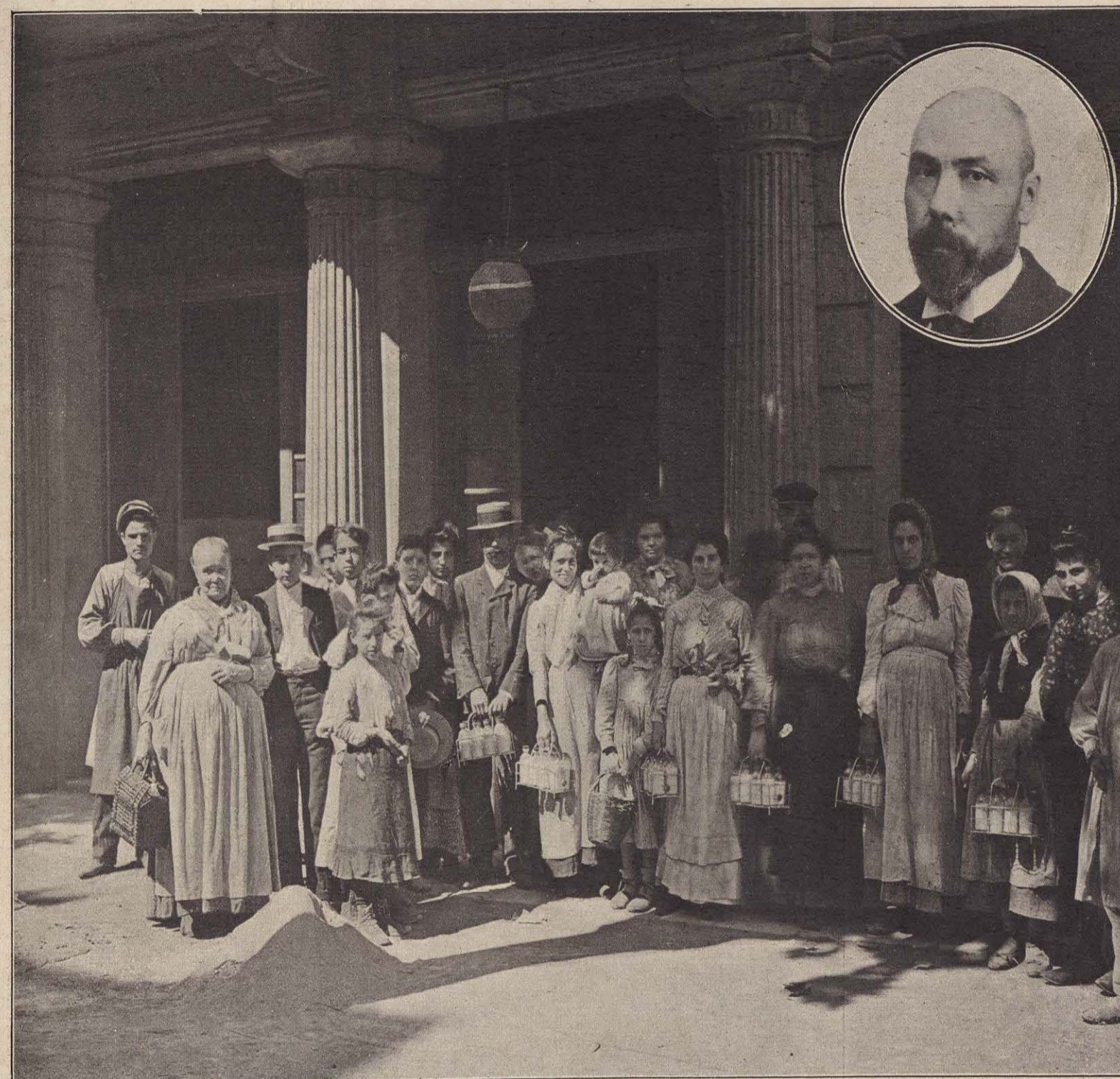
LACTANCIA ARTIFICIAL GRATUITA PARA LA CLASE JORNALERA

La galería ó salón más grande es la de las batallas , que mide 120 metros de largo y 13 de anchura, hecha arreglar por el Rey Luis Felipe y donde se ven los nombres de todos los Príncipes, almirantes, mariscales y guerreros célebres de Francia, muertos ó heridos combatiendo por su patria, en 16 tablas de bronce, 82 bustos y 33 grandes lienzos, ejecutados por los más célebres pintores de la época, y simulando los principales hechos bélicos de la historia francesa.