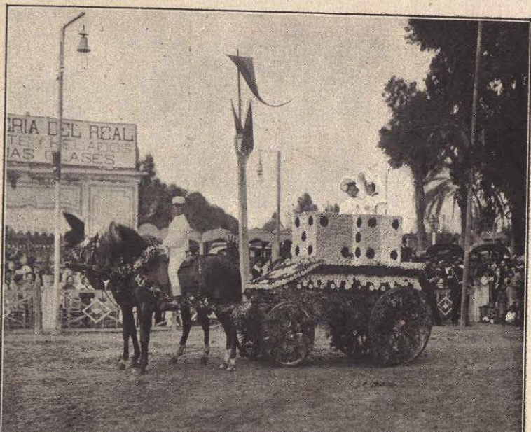
BATALLA DE FLORES