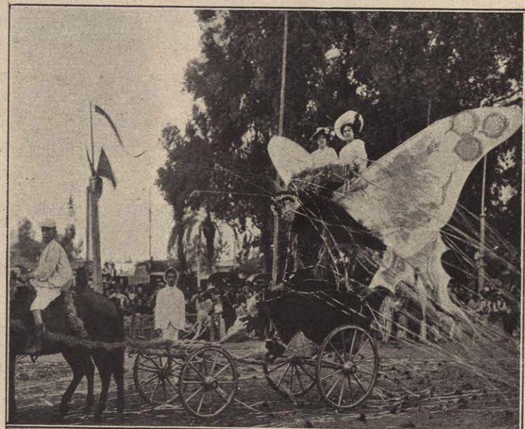
BATALLA DE FLORES — QUINTO PREMIO. — MARIPOSA.