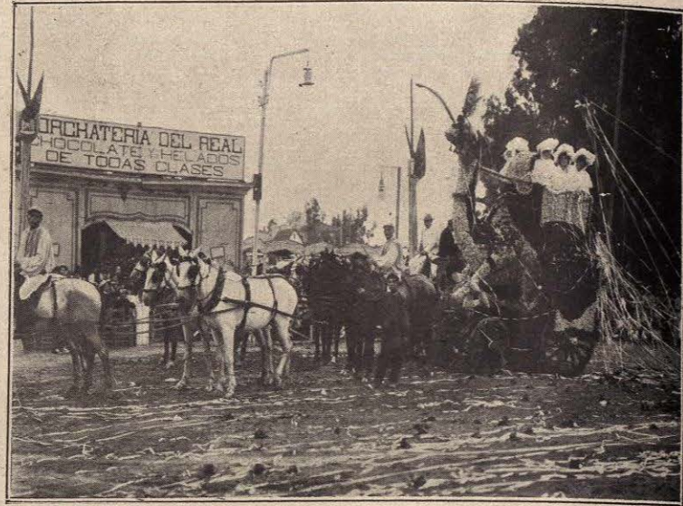
SEGUNDO PREMIO. — CAMELLO.