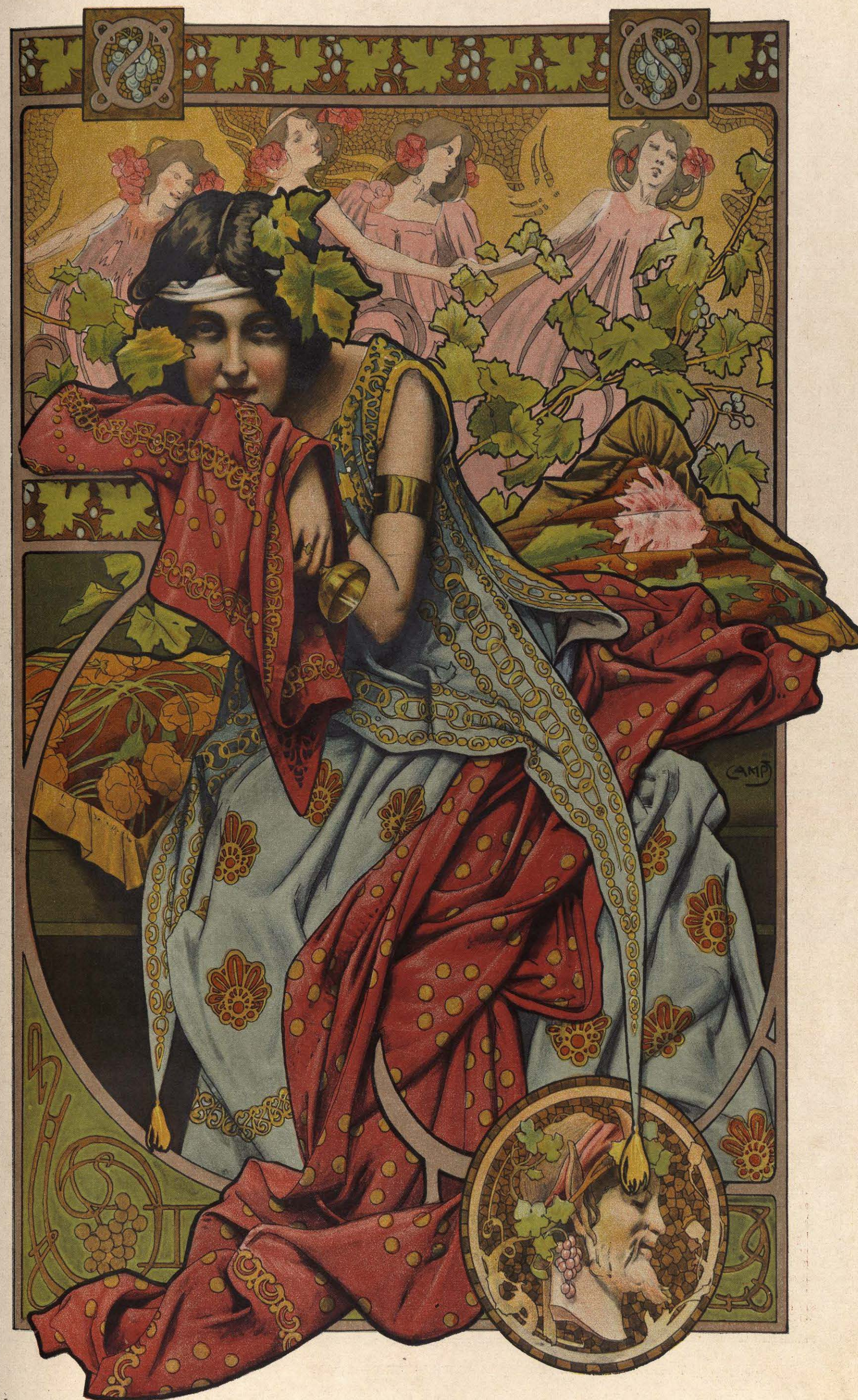
Dibujo de GASPAR CAMPS.

Nuevas máquinas tricotasas para medias, calcetines, y todos los artículos de punto sin costura, conocidos hasta el día. Especialidad para hacer el talón de las calcetas automáticamente, sin complicaciones y con una producción no aventajada por ningún otro sistema. Las mejores para familias, talleres, y fábricas. Se venden desde 300 ptas., con un libro especial para la enseñanza. CASA AGUSTI, fundada en 1888. — Bruch, 91, bajos, BARCELONA. — Agujas para máquinas de todos sistemas.