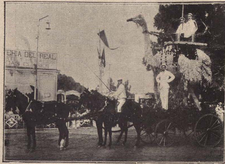
PRIMER PREMIO. — AVESTRUZ.