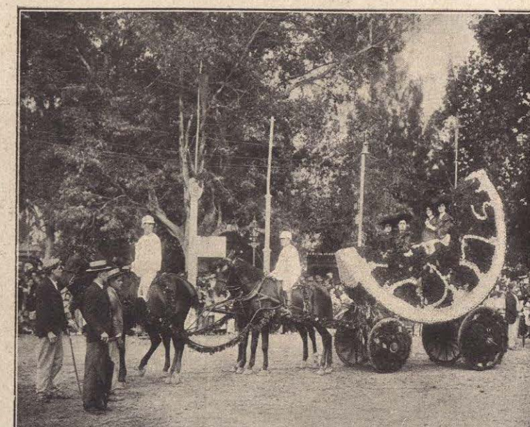
BATALLA DE FLORES