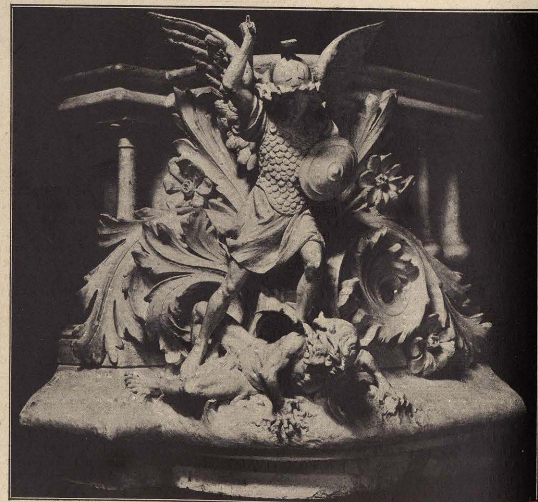
SAN MIGUEL — Escultura de José Piquet.

Son las dos... ¡Cuánto tarda la mañana! ¡Esta noche es un lóbreo desierto! ¿Quién tocará esa fúnebre campana? Tal vez será por mí... pero... ¡no he muerto! ¡Qué solo estoy, Señor! ¡Nadie me asiste! ¡Si estaré delirando!... ¿Quién me nombra? ¿Quién será esa mujer pálida y triste que me tiende sus brazos en la sombra? Caen sus negros bucles desprendidos sobre su faz de pálida azucena, y el eco de su voz, en mis oídos como inefable música resuena! ¿En dónde he visto esa mujer tan bella? ¡Qué dulce y expresivo es su semblante! ¿Será Marta?... ¡tal vez! pero al ser ella, ¡cómo no conocerla en el instante! ¡Pero se val... Resbala por la estancia y me sonríe con tristeza suma; dejando en pos de sí suave fragancia