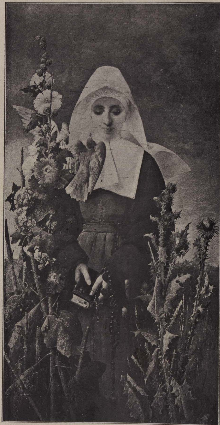
FLORES Y ESPINAS.

palomas, á arrullar su oído con una melodía celeste. Allí, en las horas de las dulces expansiones, oye en su alcoba como batir de alas ó como rumor de besos. Es que los espíritus puros tienen fiesta en la boda de las almas y aletean y se besan alegres, trayendo entre sus brazos á esas otras almas purísimas, recientemente creadas, que van á tomar la forma humana en medio de los transportes del amor.