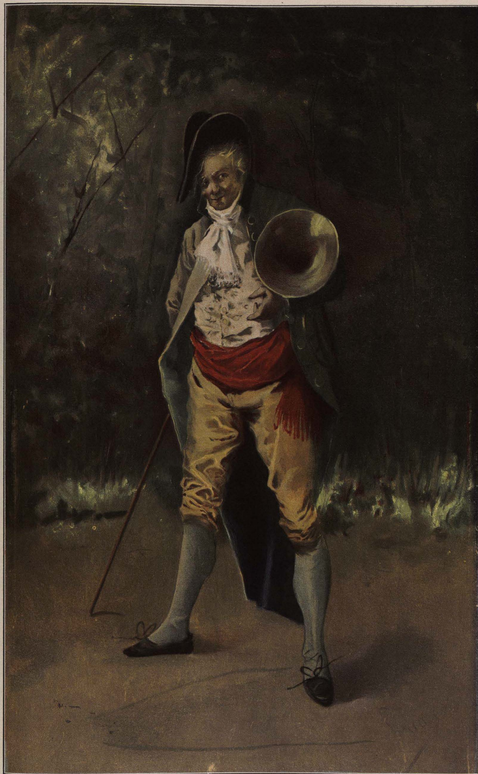
RECUERDOS DEL TIEMPO VIEJO