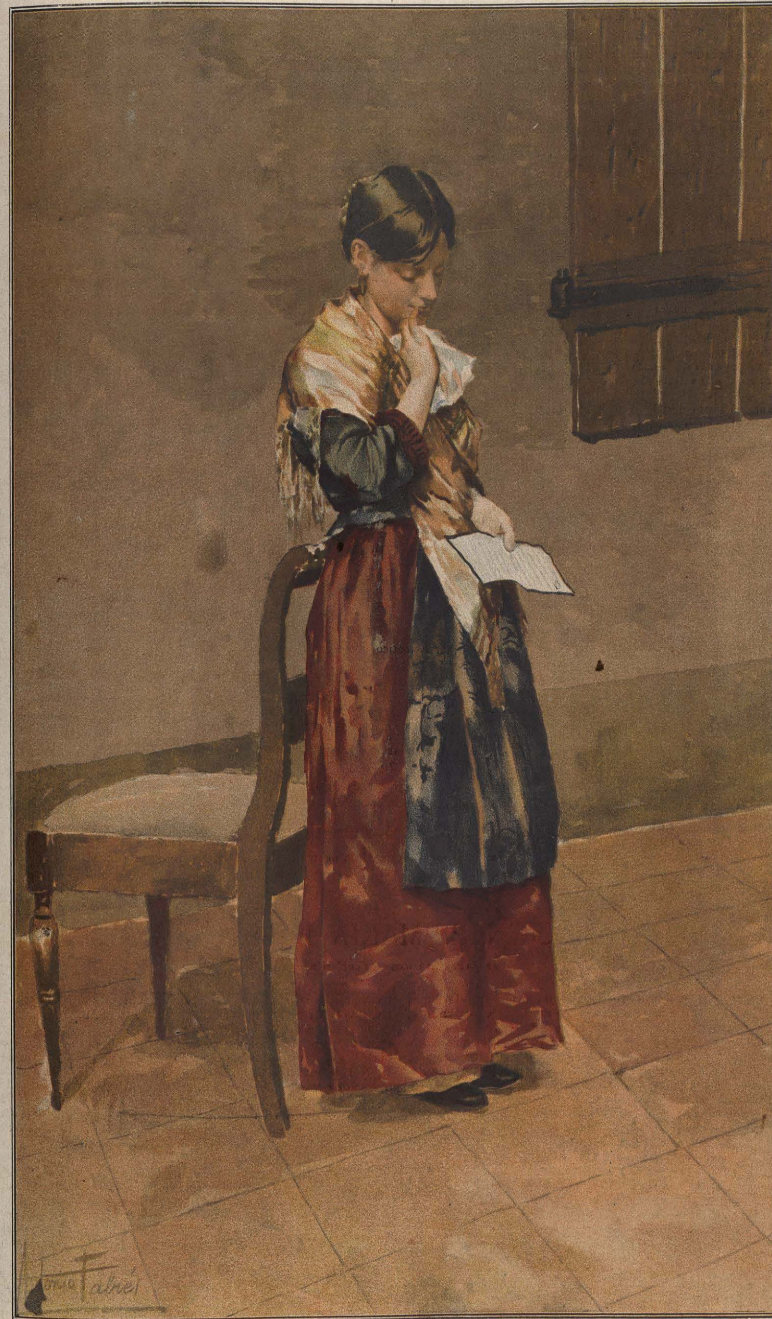
Acuarela de ANTONIO FABRÉS.