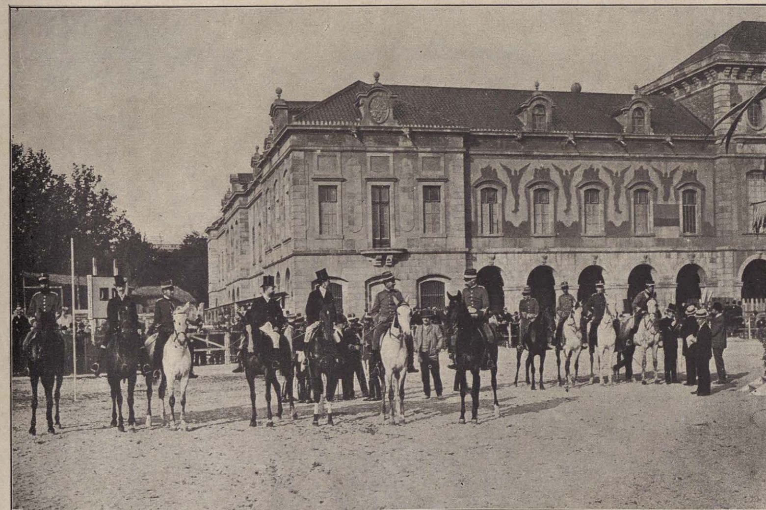
CONCURSO HÍPICO — LA TRIBUNA. — CABALLOS VENCEDORES EN LAS PRIMERAS CARRERAS.