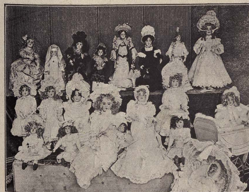
MUÑECAS FUERA DE CONCURSO POR VOLUNTAD DE LAS DONANTES.