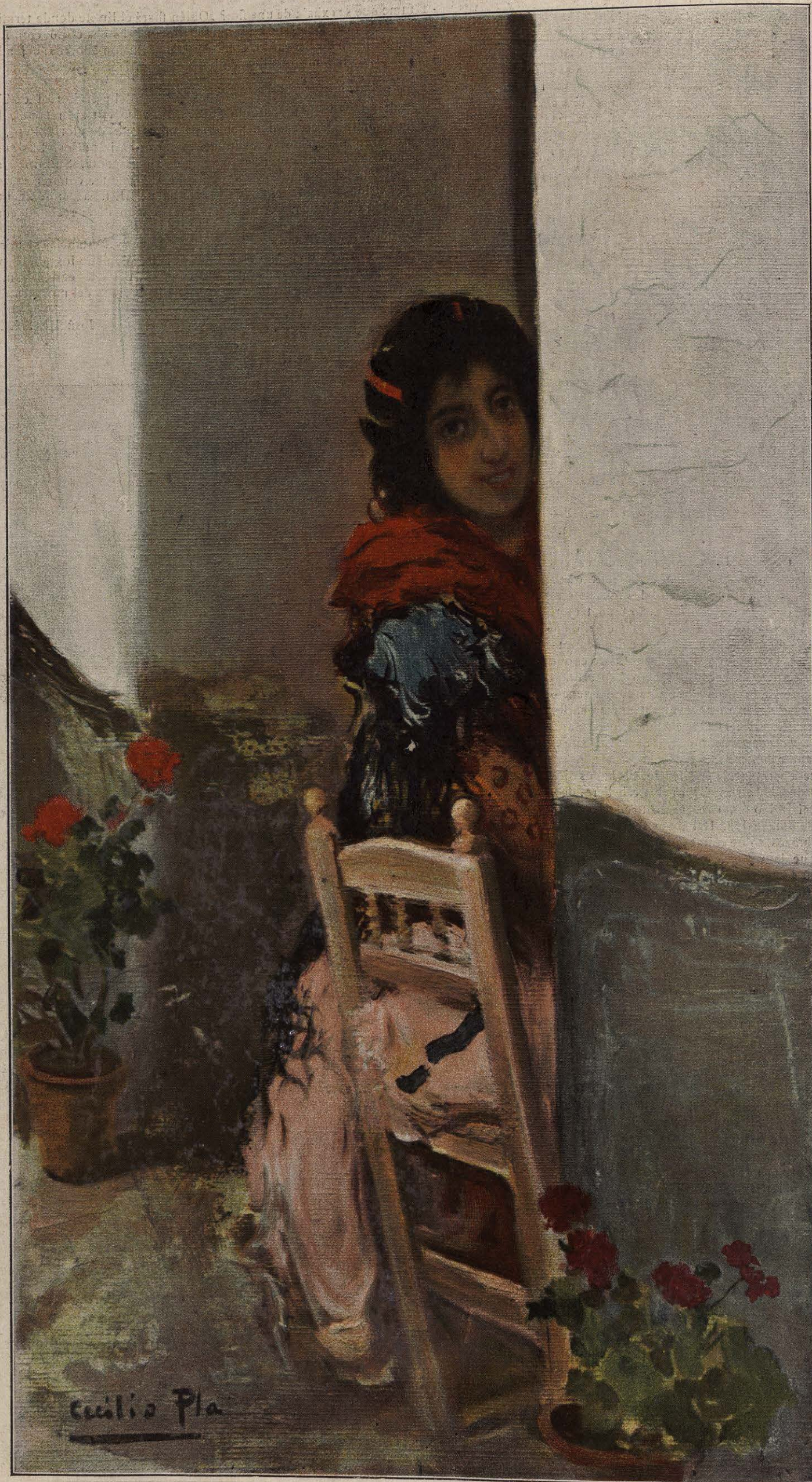
VIENDO SI PASA