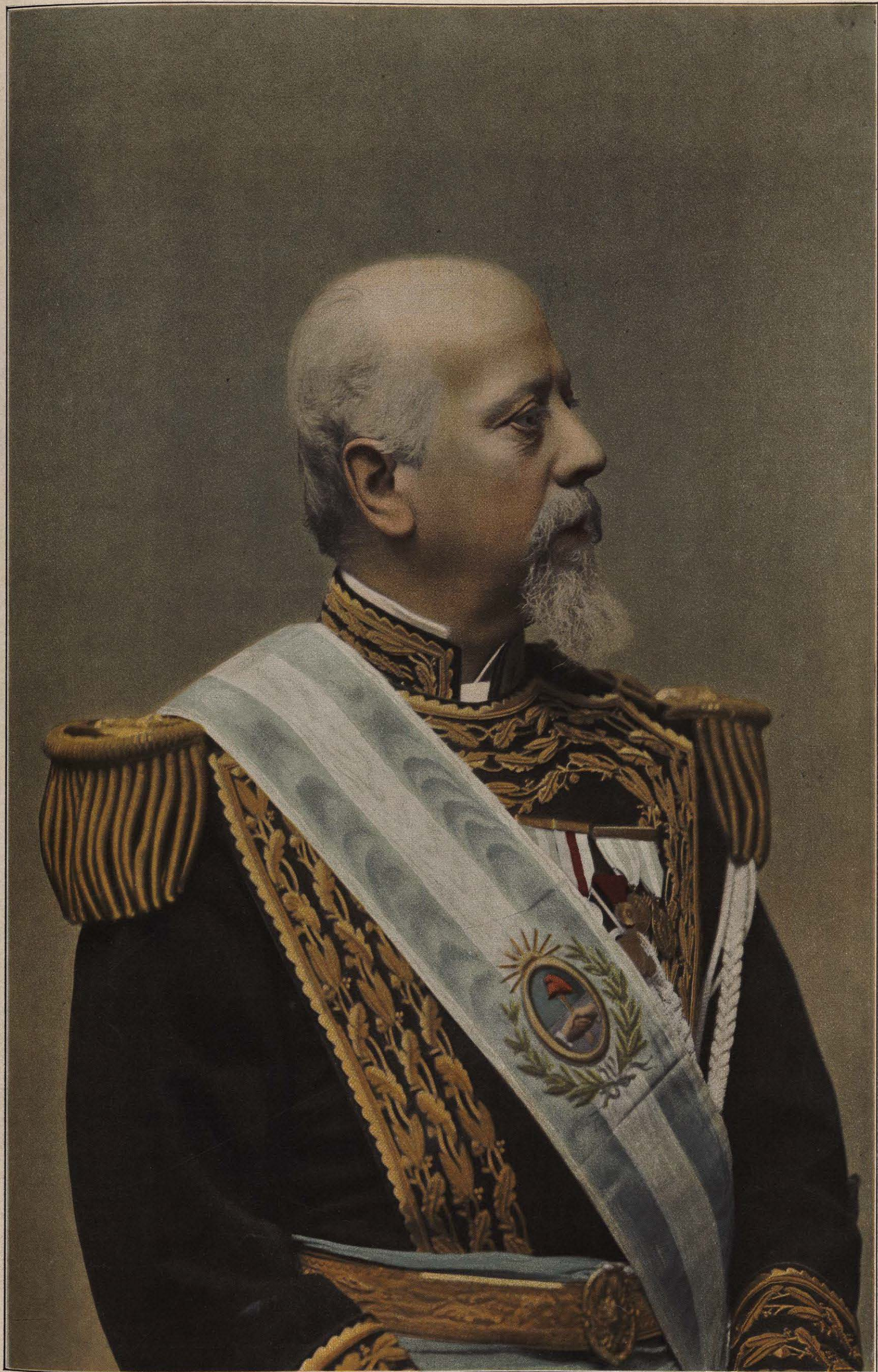
ULTIMO RETRATO DEL GENERAL JULIO A. ROCA; PRESIDENTE DE LA REPUBLICA ARGENTINA.