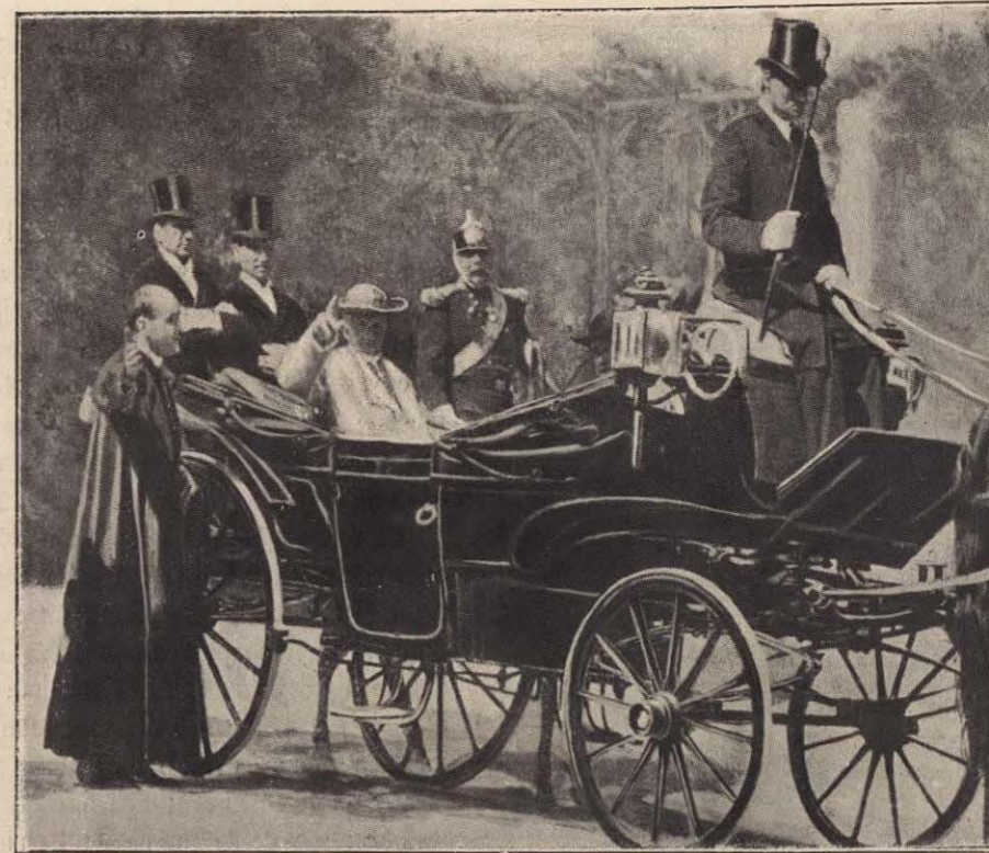
EL PAPA PASEANDO EN SU COCHE POR LOS JARDINES DEL VATICANO.

Forman parte asimismo de la familia pontificia cuatro Camareros secretos participantes : el Copero , que en las comidas solemnes sirve al Pontífice y ostenta en la mano, el Domingo de Ramos, las palmas y los cirios del Papa; el Secretario de Embajada , que lleva á los Soberanos y Príncipes extranjeros las palmas y cirios benditos; el Guardarropas , que