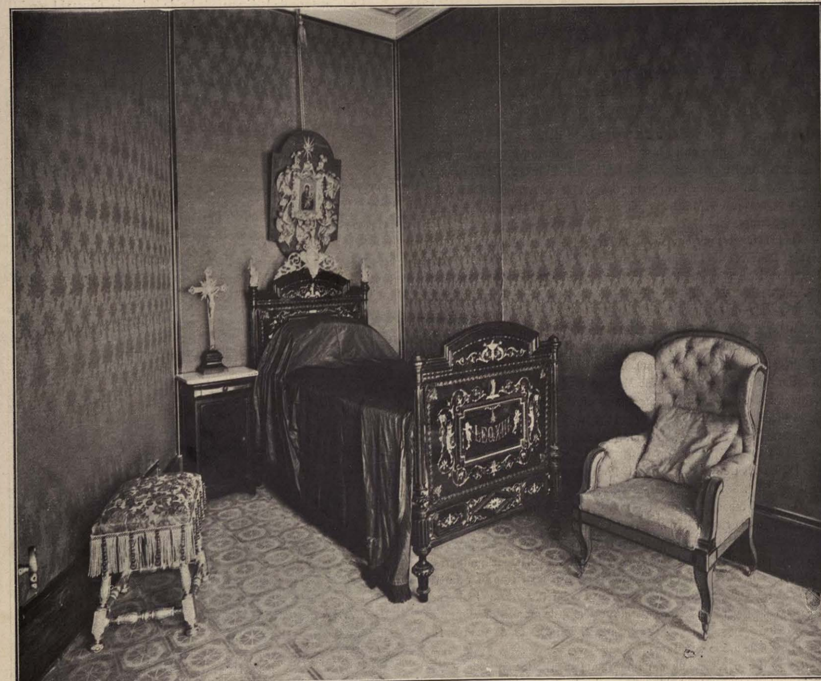
DORMITORIO DEL PAPA EN LA TORRE LEONINA (JARDINES DEL VATICANO).

El plenum del mismo, fijado por Sixto V, es de 70 miembros; pero nunca lo ha alcanzado. En la actualidad existen doce vacantes. De los