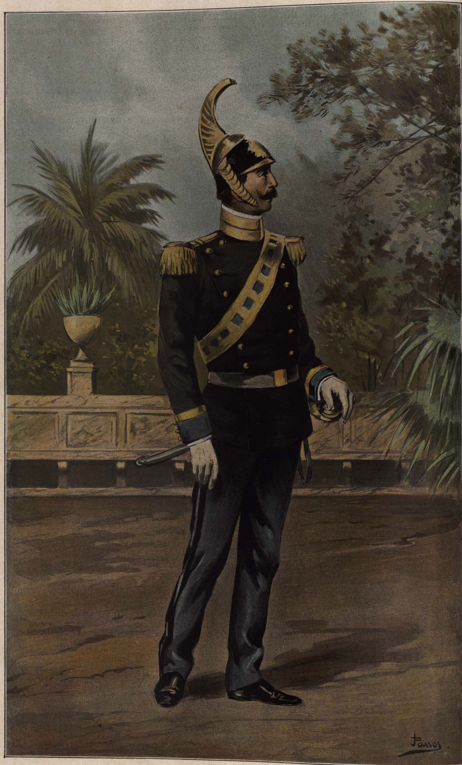
GUARDIA NOBLE DEL PAPA; por José PASSOS.

El Auditor Santísimo; que tiene, entre otras atribuciones, la de indagar los méritos de las personas que deben ser promovidas al Episcopado ó trasladadas á otras Sillas. Antiguamente tenía jurisdicción contenciosa; pero su tribunal fué abolido en 1831 por orden de Gregorio XVI. Si no es nombrado á Cardenal, continuará en sus funciones bajo el nuevo Pontífice.