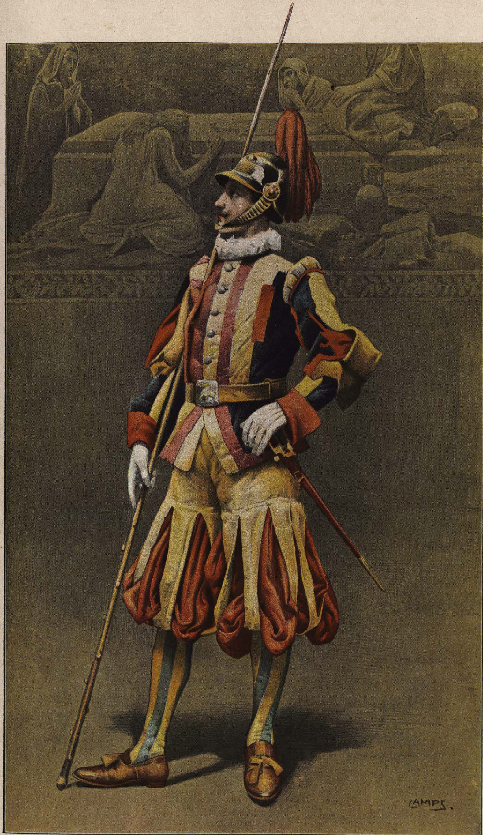
GUARDIA SUIZO DEL PAPA; por GASPAR CAMPS.