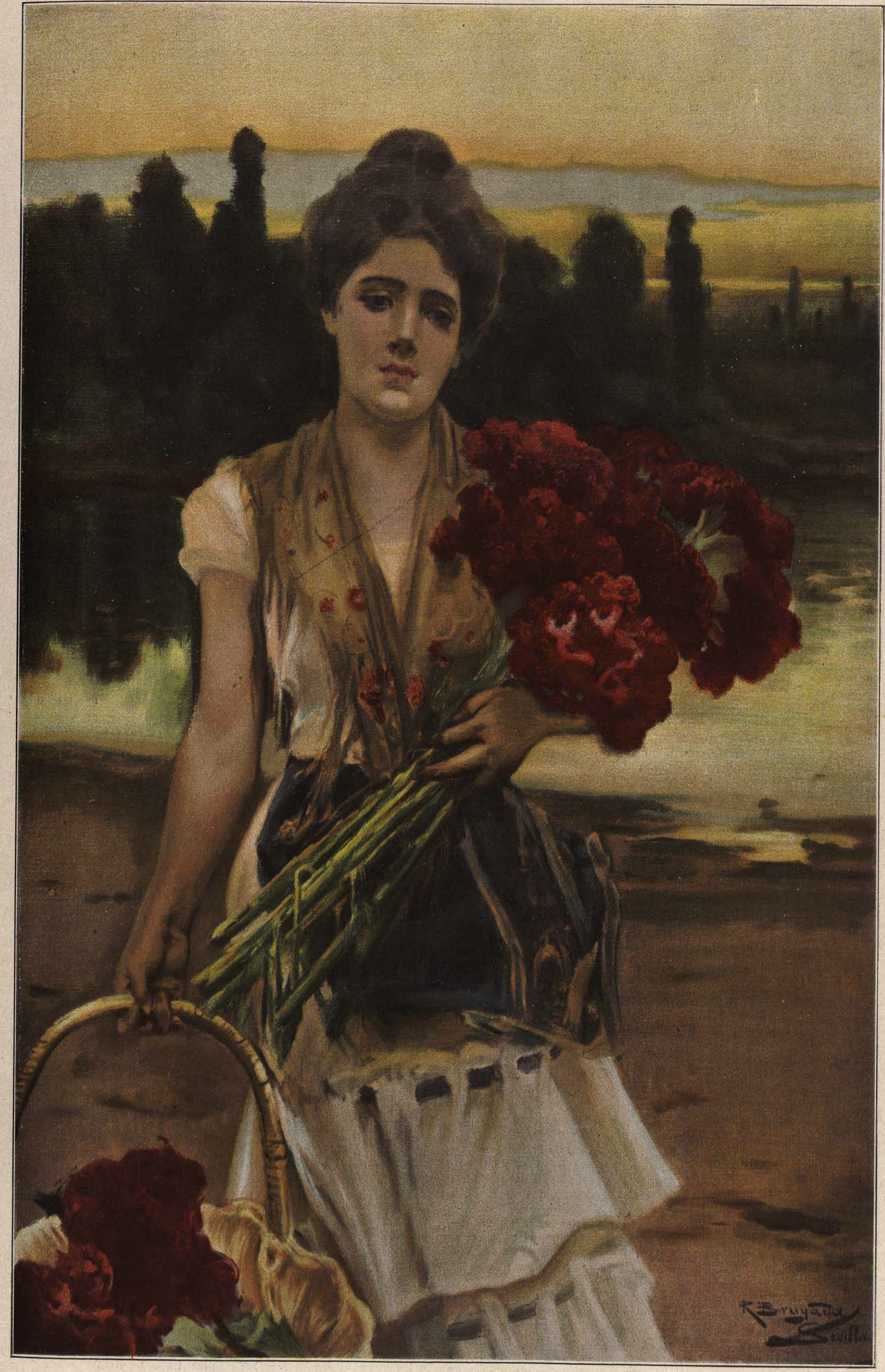
Cuadro de RICARDO BRUGADA.