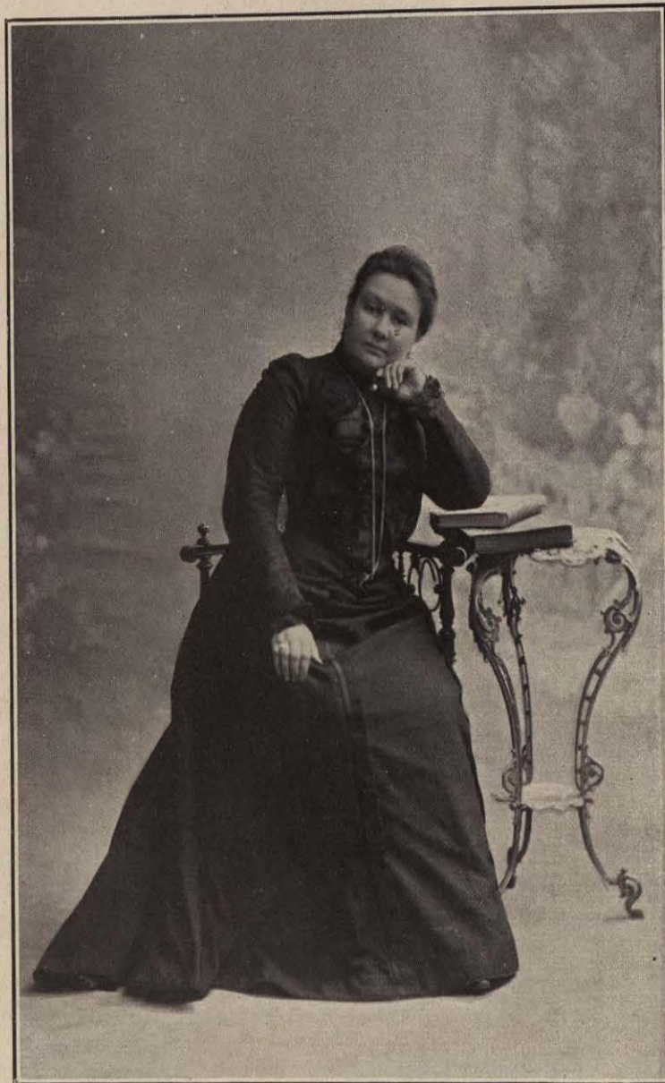
LA BARONESA DE WILSON

Por hoy, ha sido dedicada nuestra labor a la eminente profesora tucumana a quien rendimos un tributo de justa admiración.