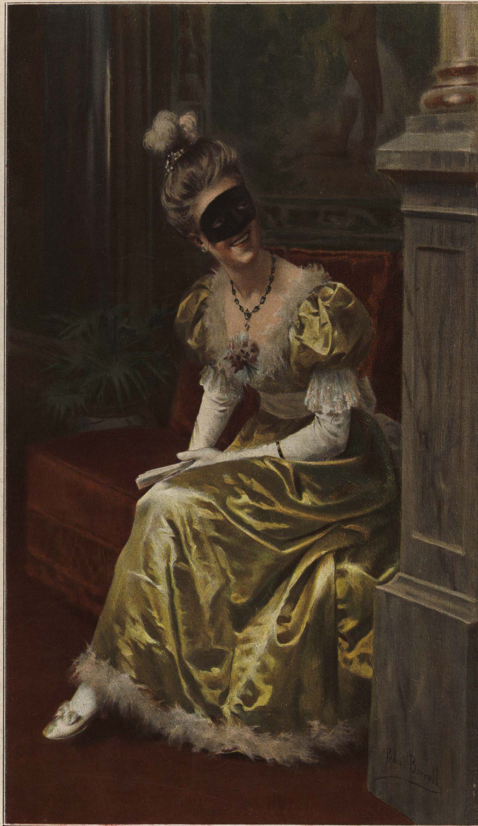
Cuadro de PEDRO BORRELL.

La Administración de esta revista garantiza el éxito en la venta de los artículos que en la misma se anuncian siempre que sean apropiados á ella, como Joyería de arte, Relojería superior, Ferrería fina, Perfumería selecta, Pianos, Muebles de lujo, Industrias artísticas, y toda clase de géneros superiores, propios para las personas de elevada posición.