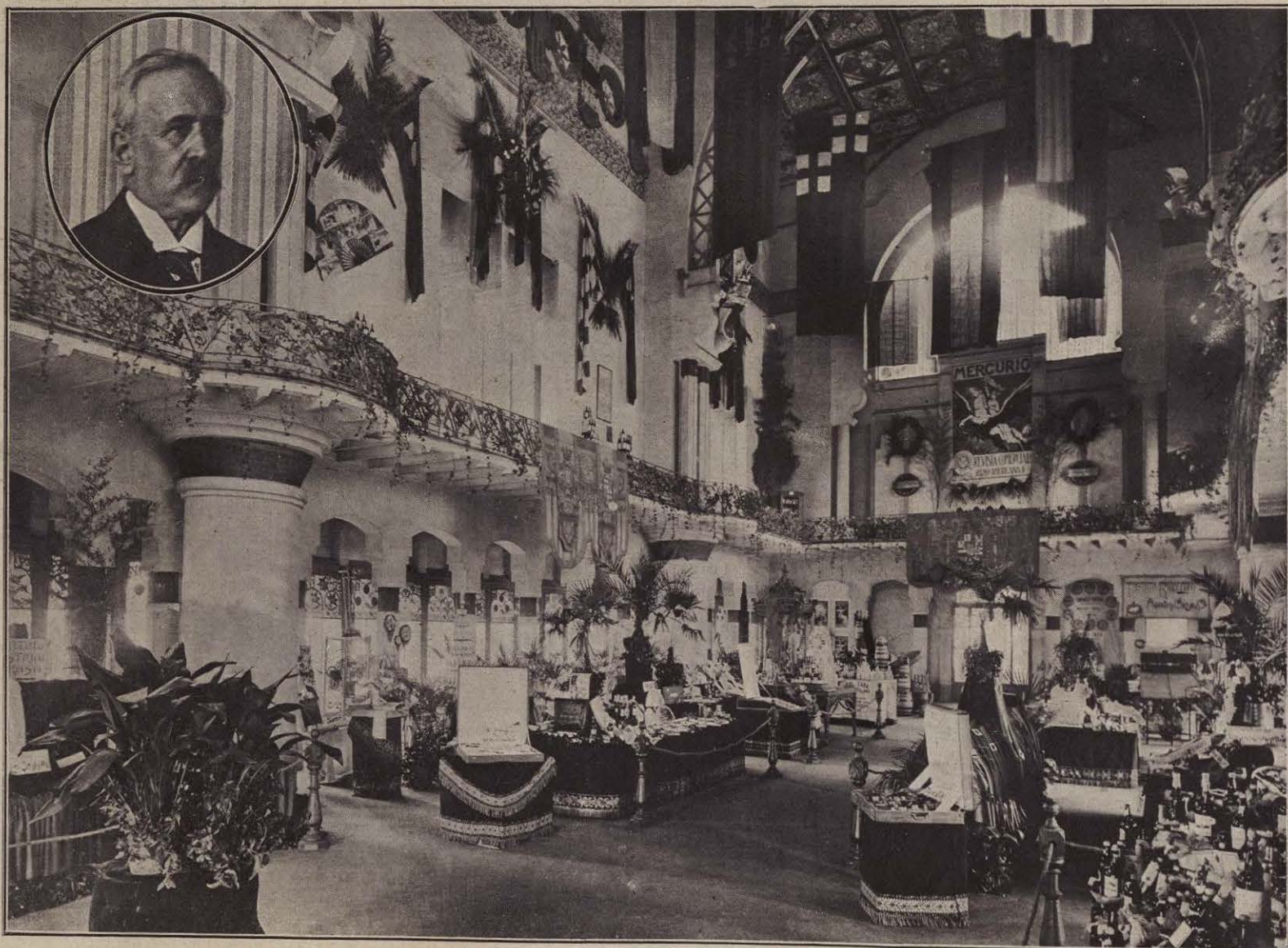
EL DR. QUIRNO COSTA, VICEPRESIDENTE DE LA REPÚBLICA ARGENTINA. EXPOSICIÓN DE LOS PRODUCTOS QUE LE FUERON OFRECIDOS Á SU PASO POR BARCELONA.