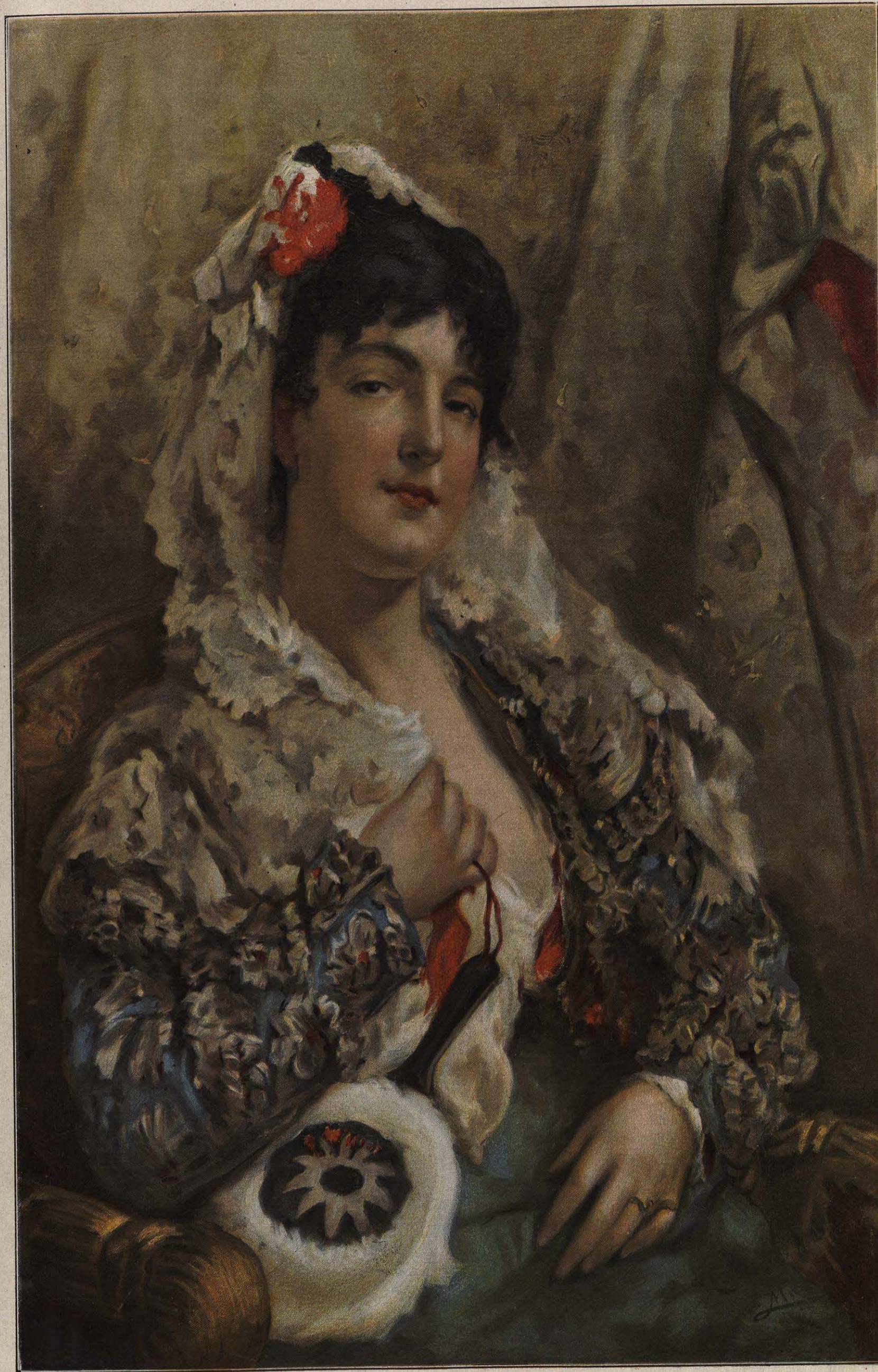
Copia del celebrado cuadro La Maja , de J. CASADO DEL ALISAL.

La Administración de esta revista garantiza el éxito en la venta de los artículos que en la misma se anuncian siempre que sean apropiados á ella, como Joyería de arte, Relojería superior, Pedrería fina, Perfumería selecta, Pianos, Muebles de lujo, Industrias artísticas, y toda clase de géneros superiores, propios para las personas de elevada posición.