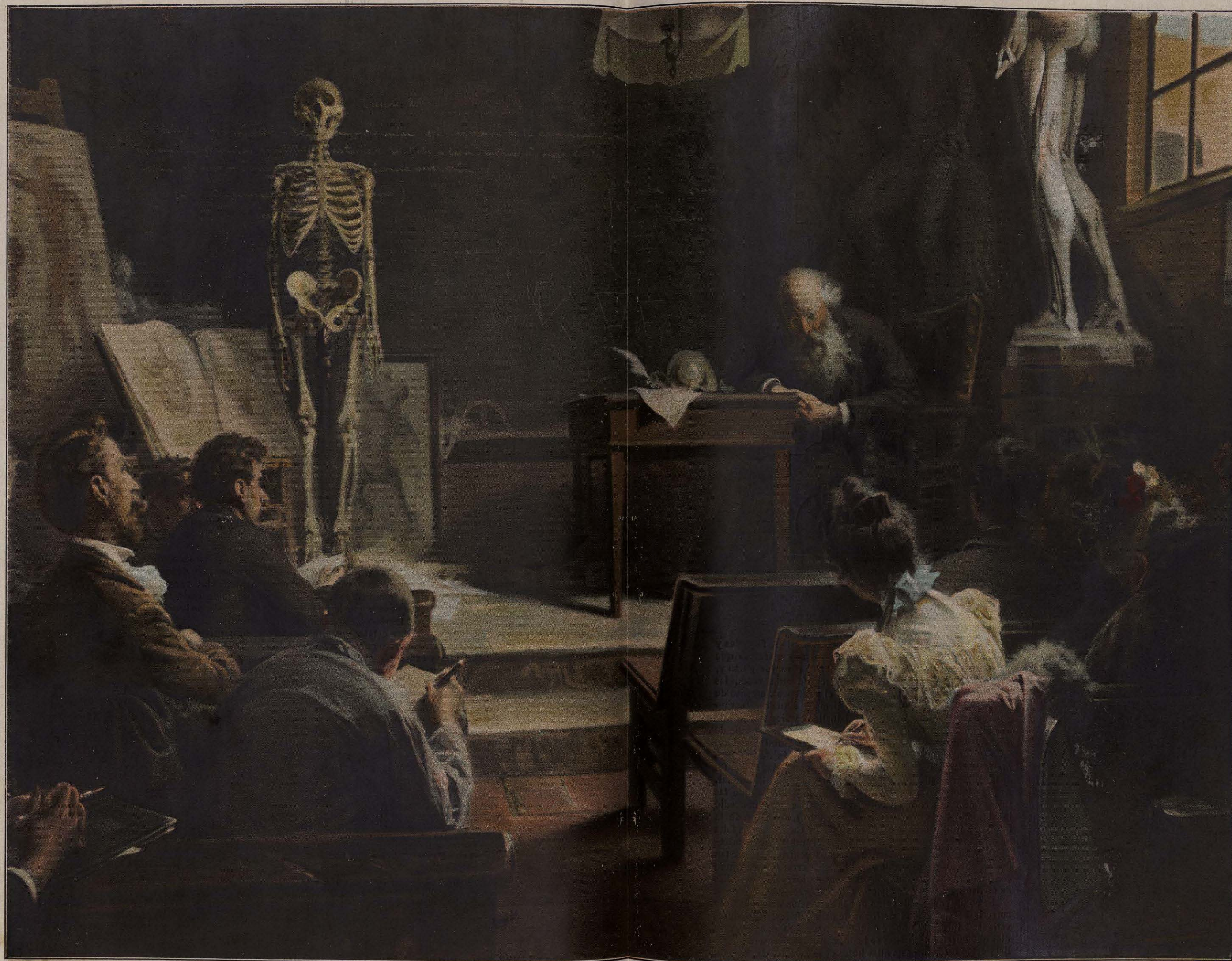
LECCIÓN DE ANATOMÍA