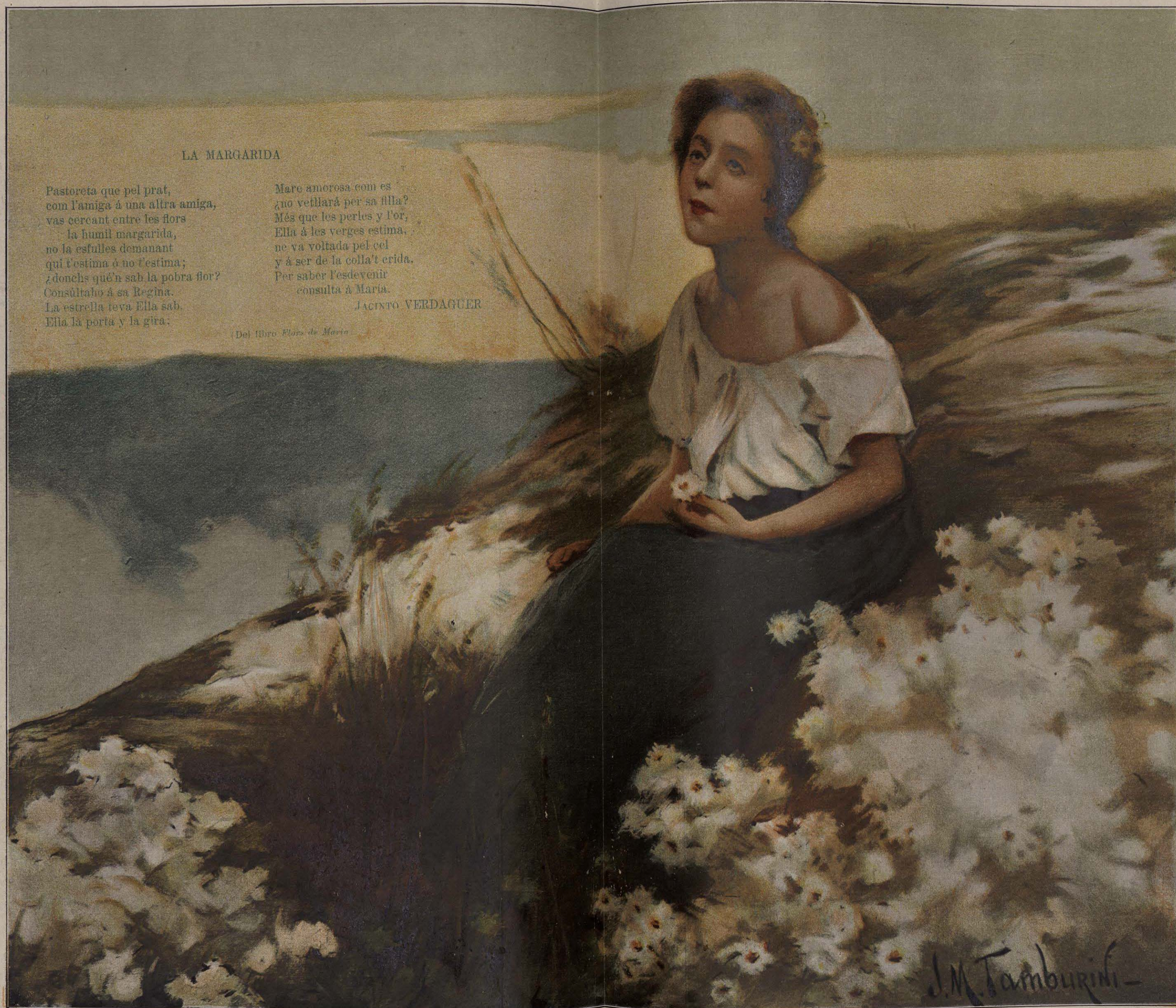
Cuadro de José M. TAMBURINI.