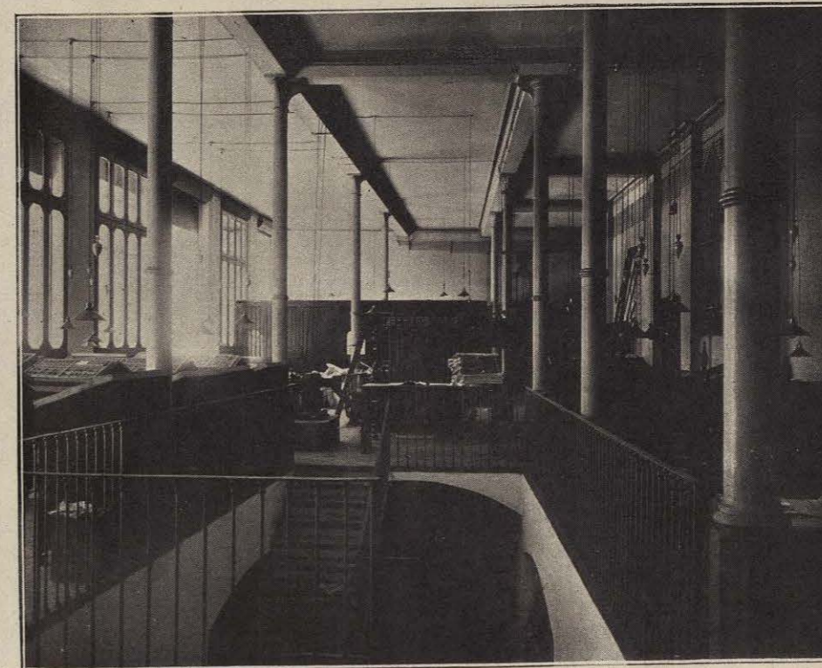
TALLERES EN LA PLANTA BAJA. Cajas, rotativa, motor eléctrico y departamento de vendedores.

locales tienen luz propia abundantísima, y para la noche alumbrado eléctrico, verdaderamente espléndido, compuesto de dos arcos voltaicos y 125 lámparas de incandescencia, hábilmente distribuidas por todas las dependencias.