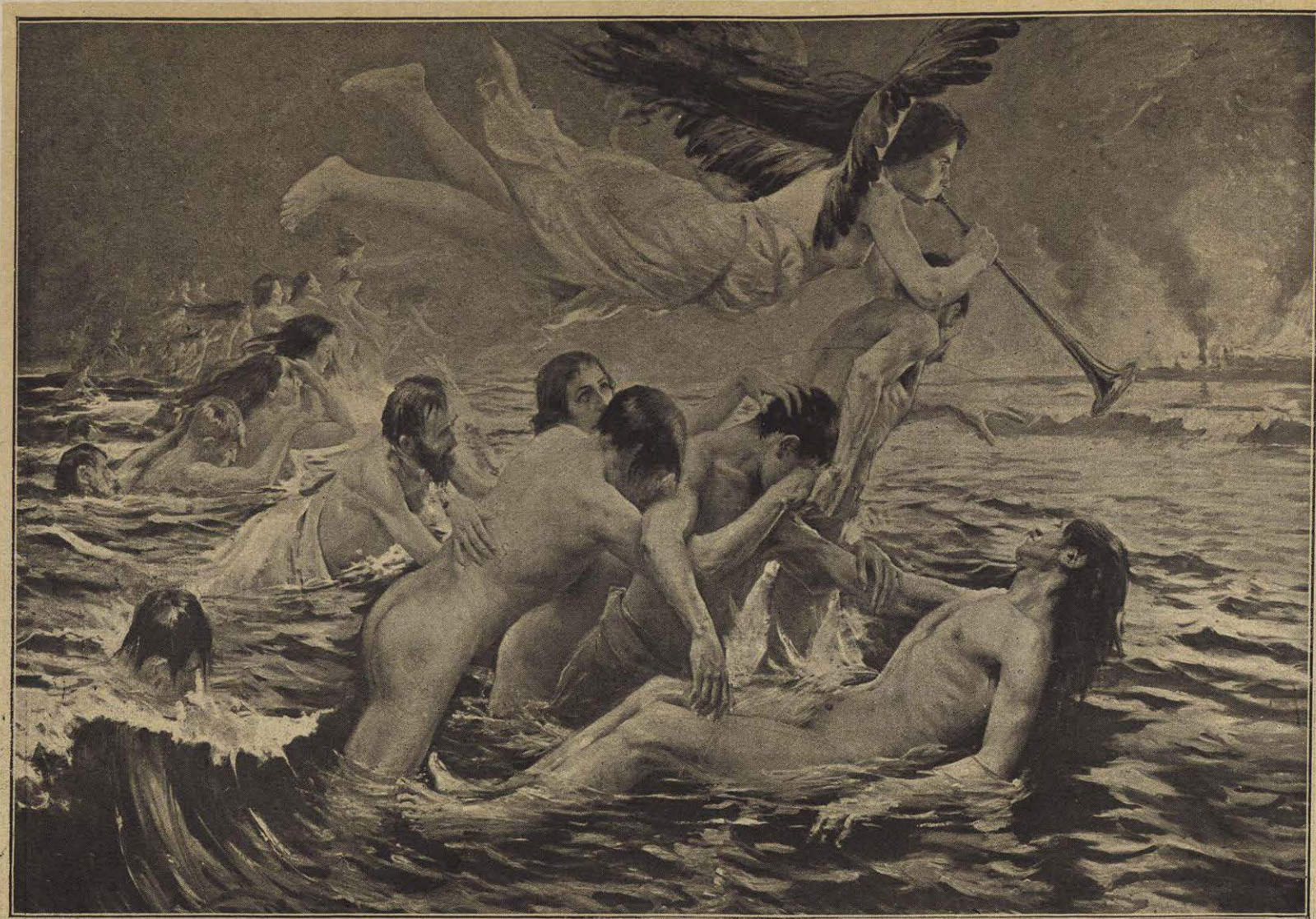
LA RESURRECCIÓN DE LA CARNE — Cuadro de MARCELINO SANTA MARÍA.