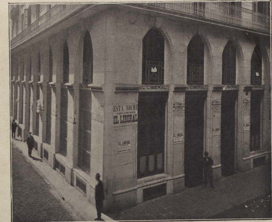
EDIFICIO DE NUEVA CONSTRUCCIÓN EN QUE ESTÁ INSTALADO. Calle del Conde del Asalto, esquina á la del Este, números 39 y 41.

En los sótanos, se ha instalado la estereotipia, almacenes de papel, sección de repartidores y correo. Durante el día, todos los