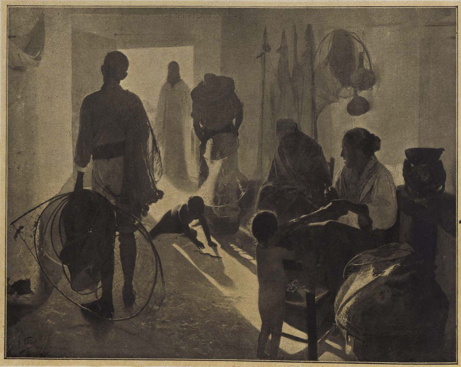
LOS AMIGOS DE JESÚS — Cuadro de ANTONIO FILLOL.