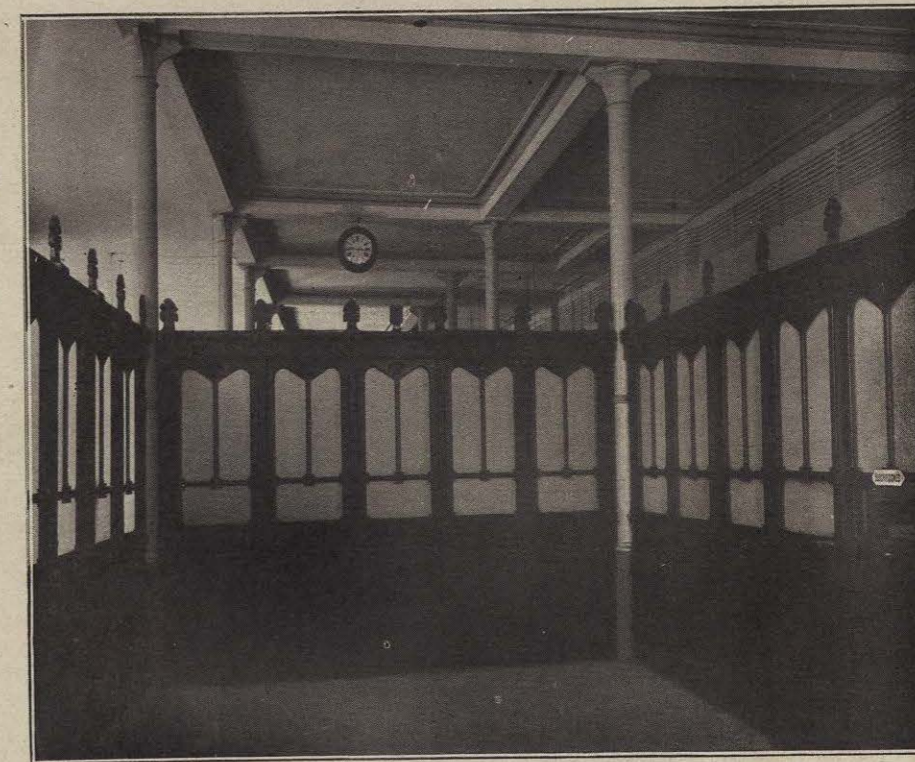
VESTÍBULO CENTRAL. Administración, Redacción, Dirección local y Dirección general.