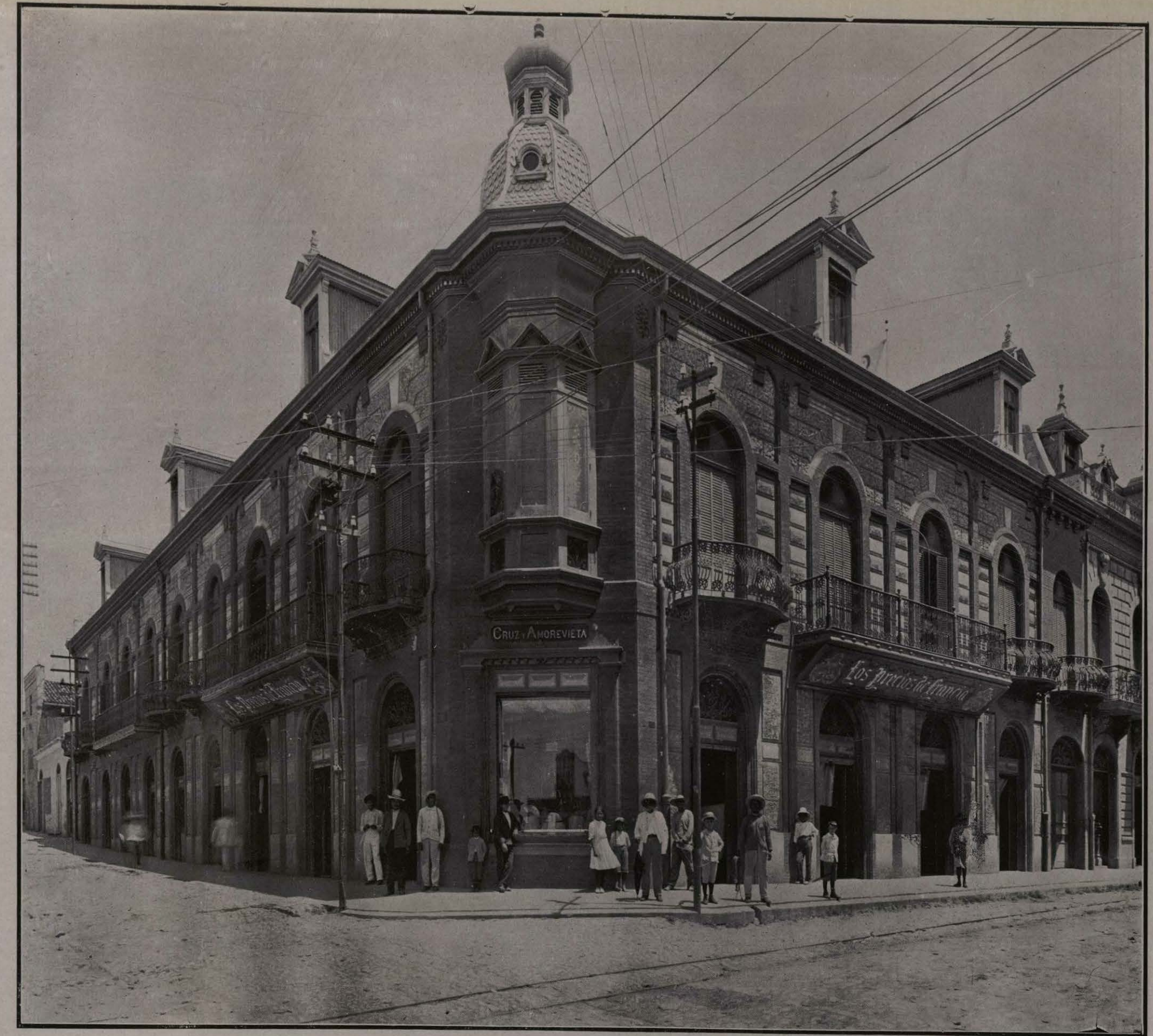
EDIFICIO DE "LOS PRECIOS DE FRANCIA." TAMPICO, TAMAULIPAS.

El "Tritón" ha extinguido ya muchos incendios en la bahía y en la población; caso notable de salvamento fué el del vapor inglés "Arguill;" al intentar ganar el puerto sin práctico, embarrancó sobre las escolleras á toda máquina, choque que produjo una vía de agua de treinta y siete pulgadas inglesas de largo por siete de alto. Los dos mejores remolcadores del puerto no lograron dominar la entrada del agua. Sólo el "Tritón," al cabo de dos días y una noche de trabajo, levantó la proa á tres pies de calado; ya pudo entonces repararse la avería y continuar su viaje el barco.