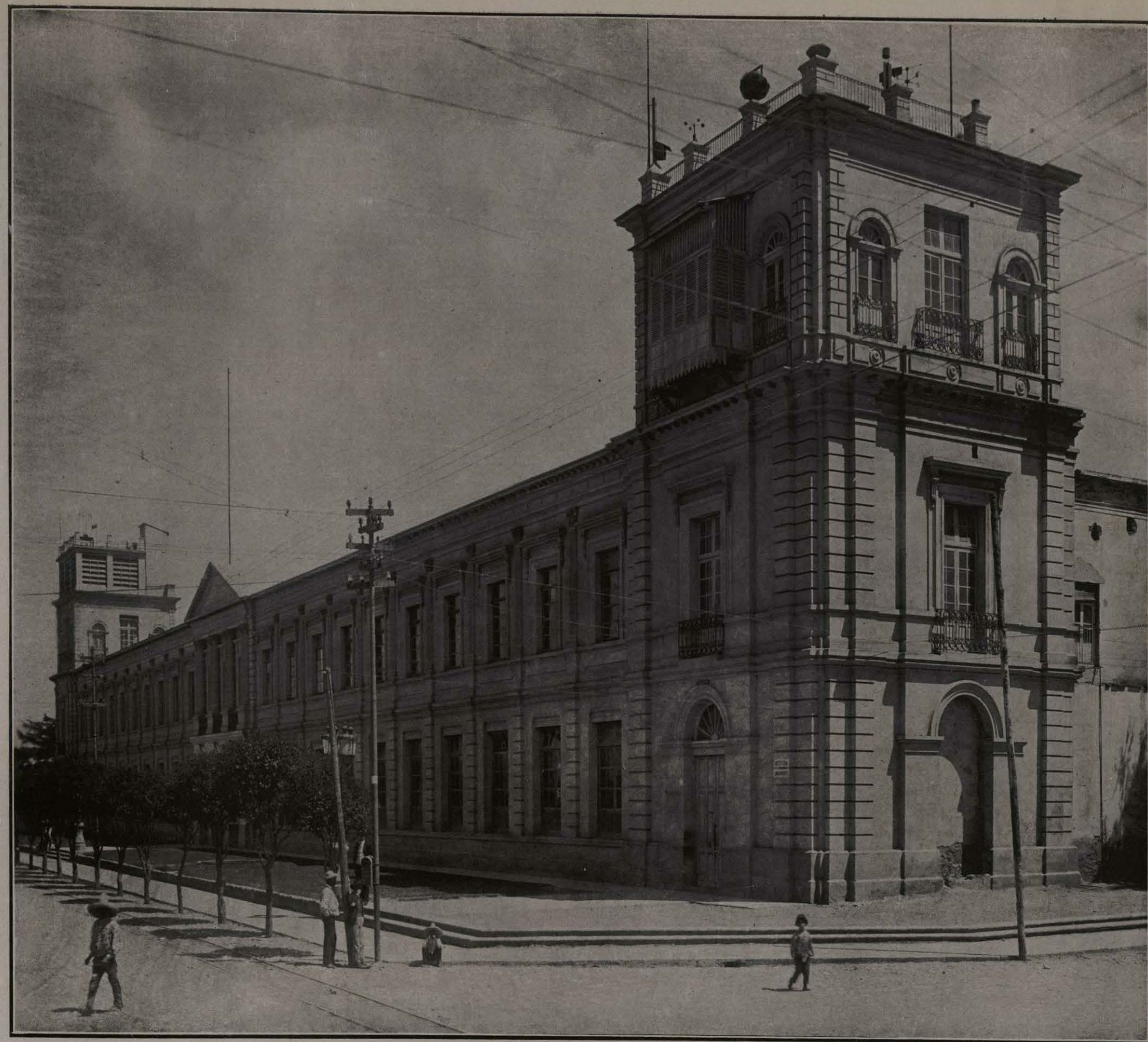
INSTITUTO "PORFIRIO DÍAZ." TOLUCA, ESTADO DE MEXICO.

Otro de los más bellos jardines de la ciudad es el Morelos, que ostenta una estatua del hombre más grande que ha producido nuestra patria. El Jardín de los Hombres Ilustres está adornado con elevado obelisco, donde aparecen inscriptos los nombres de muchos mexicanos eminentes. En alto relieve de metal luce el busto de la inspirada Décima Musa, Sor Juana Inés de la Cruz. El parque Cuauhtémoc, ó Alameda, como se le designa generalmente, es el mayor y el más hermoso jardín de la ciudad. Las calles que lo dividen simétricamente parecen delineadas por las hábiles manos de un nuevo Le Notre; las arboledas son umbrosas; el ambiente, eternamente perfumado: un pequeño lago retrata en su tersa superficie los celajes de aquel cielo límpido entre los más puros. Durante las fiestas del Centenario se inauguró la fuente monumental del artista mexicano Don Juan de Dios Fernández.