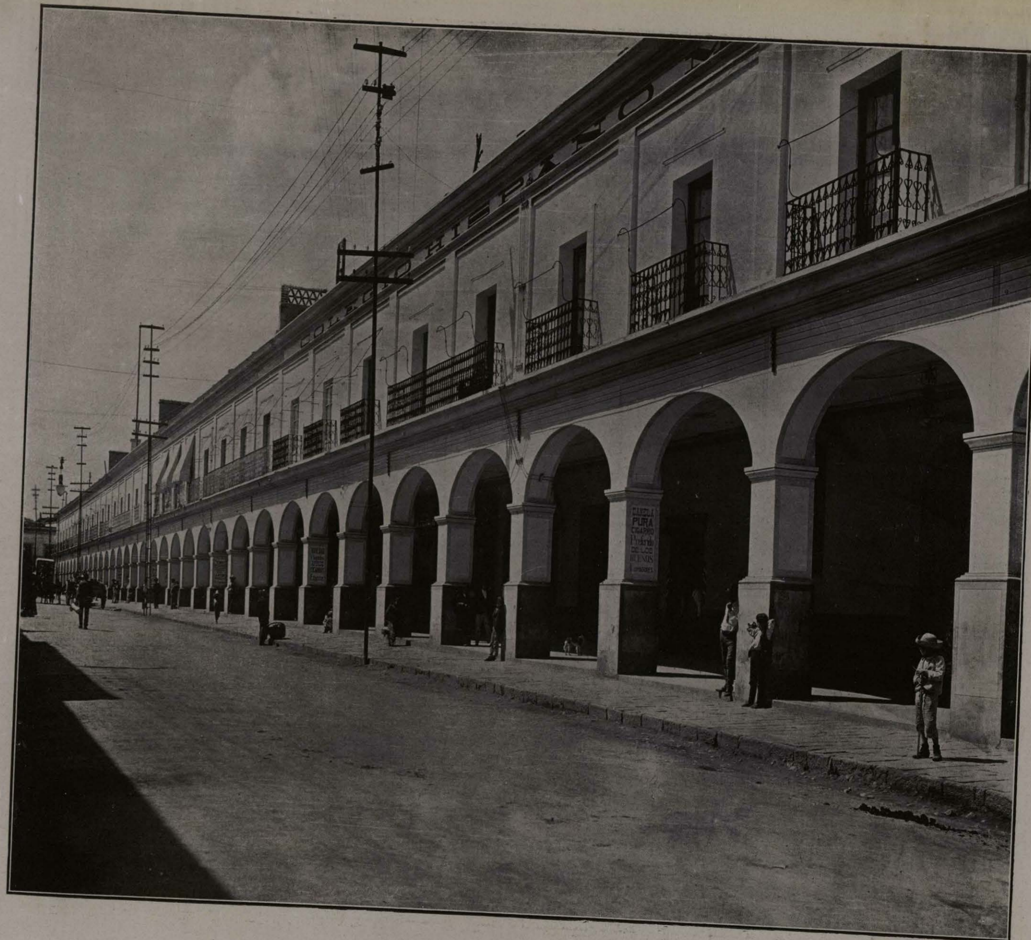
LOS PORTALES. TOLUCA, ESTADO DE MÉXICO.