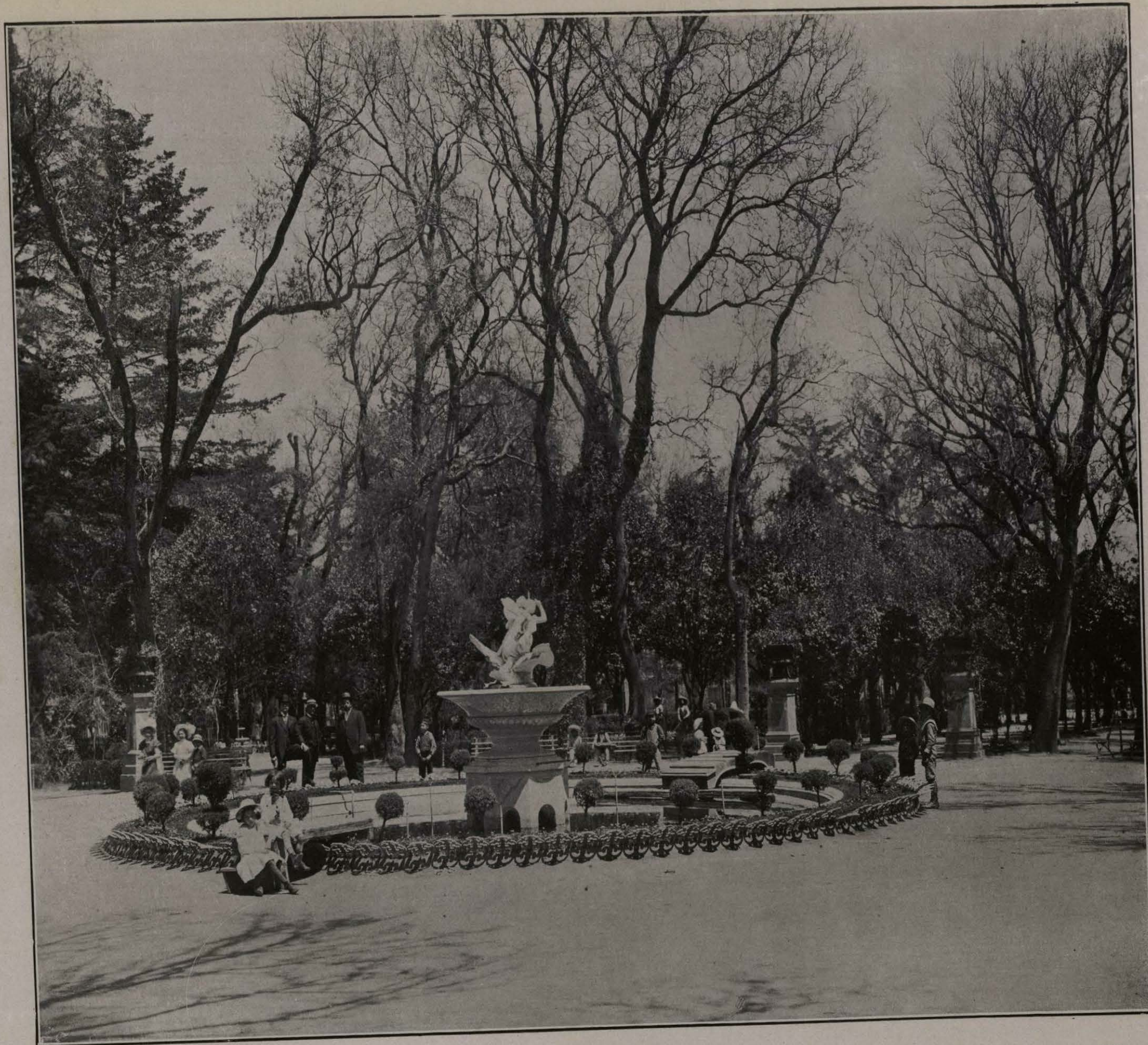
ALAMEDA DE TOLUCA. ESTADO DE MÉXICO.