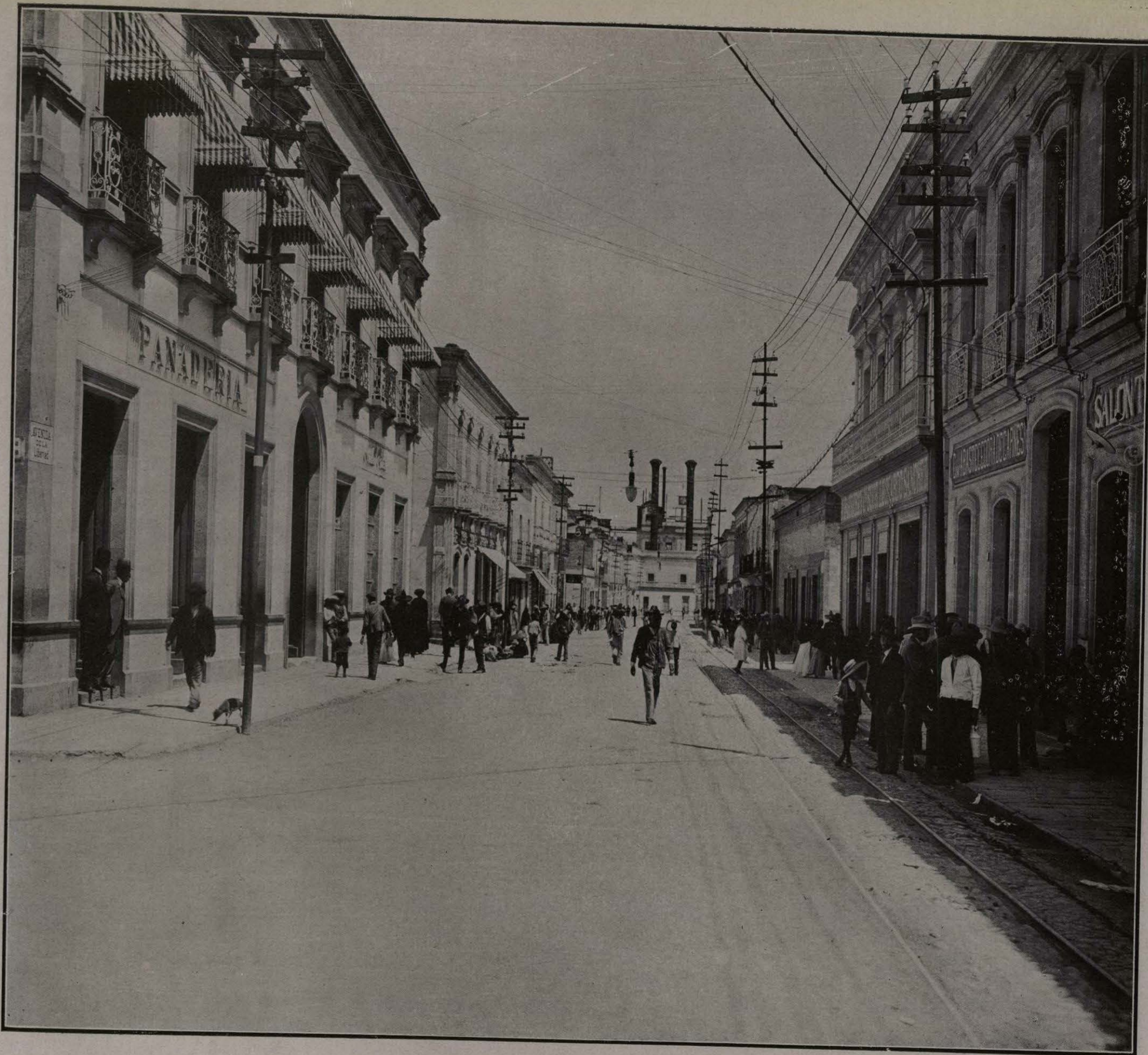
• 259 • AVENIDA DE LA LIBERTAD. TOLUCA, ESTADO DE MÉXICO.

Entre los objetos de valía que posee este santuario, deben citarse los numerosos cuadros de Cabrera, que indudablemente vino á Tepozotlán largo tiempo á trabajarlos. Dejó aquí algunas de sus obras maestras. De los más notables son los "Cenáculos," bellísimos de colorido y expresión, que se encuentran en la Sacristía. Allí se admira también una artística pila de piedra bellamente esculpida. En el recinto de la iglesia hay dos grandes cuadros, que se atribuyen al mismo pintor; uno que representa á la Virgen amamantando al niño Jesús, y otro que representa á la Virgen amamantando al niño Jesús, representando el parando á los hijos de Loyola, y otro, cuya fuerza de pincel es típica, representando el triunfo final. Existen en el Convento muchas telas de Correa, Padilla, Villalpando, Rodríguez Juárez y otros maestros. Son famosos por su riqueza los paliós, cruces, crucifijos, cálices, mitras, custodias y toda clase de objetos ricos y preciosos que tenía este monasterio. Mucho se ha perdido: sólo quedan los incomparables altares, recamados de oro, fascinación y asombro del viajero.