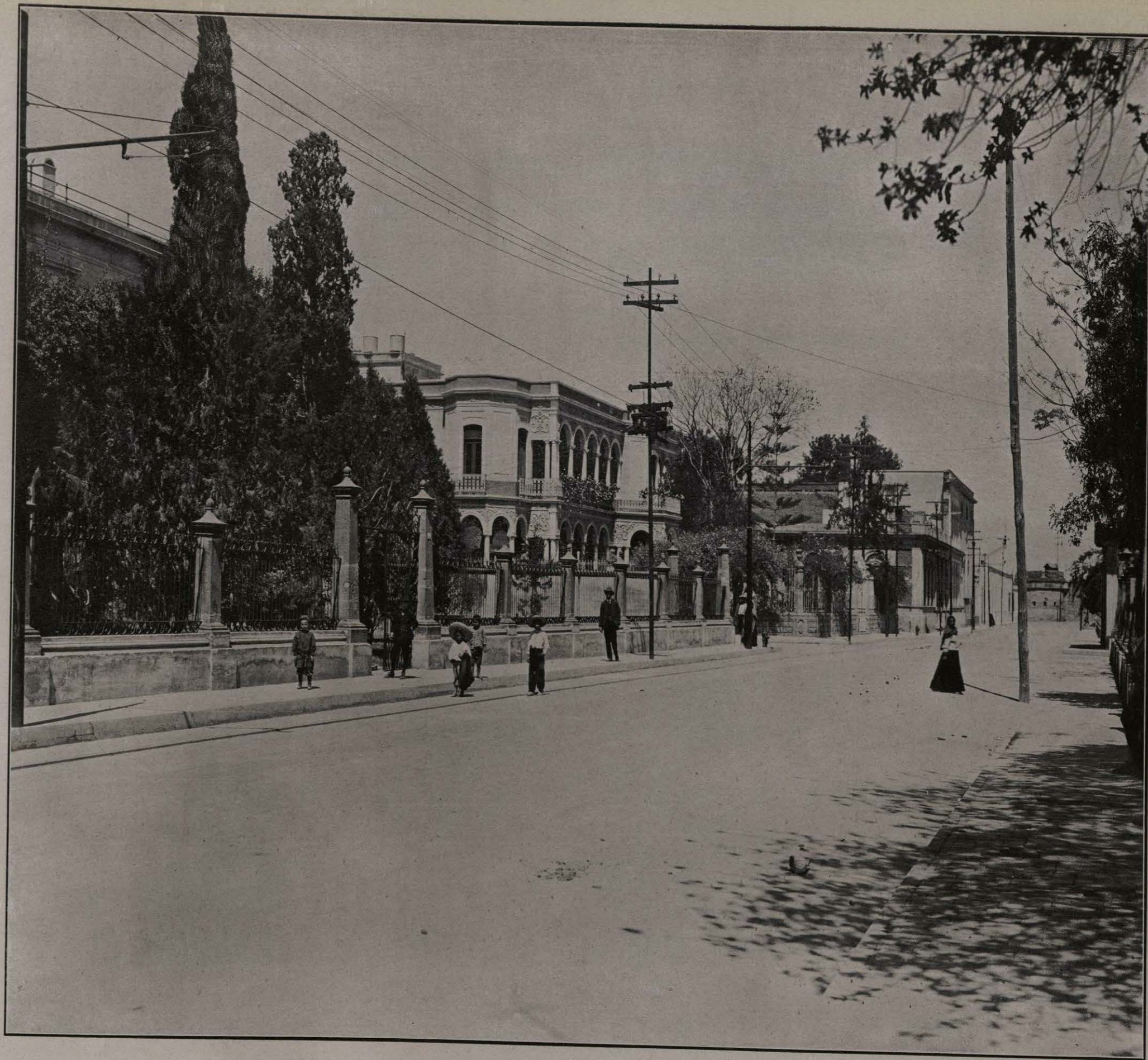
CALLE DE TOLSA. GUADALAJARA, JALISCO.

como contadoras, farmacéuticas, modistas, peinadoras, traductoras, etc.; todas ellas, han encontrado bien remunerado trabajo, y atienden honradamente al bienestar de sus familias. Ya son un buen número las señoritas que han seguido estos cursos. El plantel está admirablemente montado y cuenta con todos los elementos, útiles y aparatos indispensables á sus fines. La instrucción, en general, está muy bien organizada en el Estado de Jalisco: hay cerca de 600 establecimientos de instrucción, cuyo presupuesto anual se acerca á 400,000 pesos. Existe una importante Escuela Normal Mixta para Profesores, donde se han graduado á la fecha gran número de pedagogos. La enseñanza secundaria cuenta con un Liceo destinado á estudios preparatorios, y hay escuelas de medicina, farmacia, ingeniería y jurisprudencia. Existen, además, numerosas instituciones particulares de enseñanza.