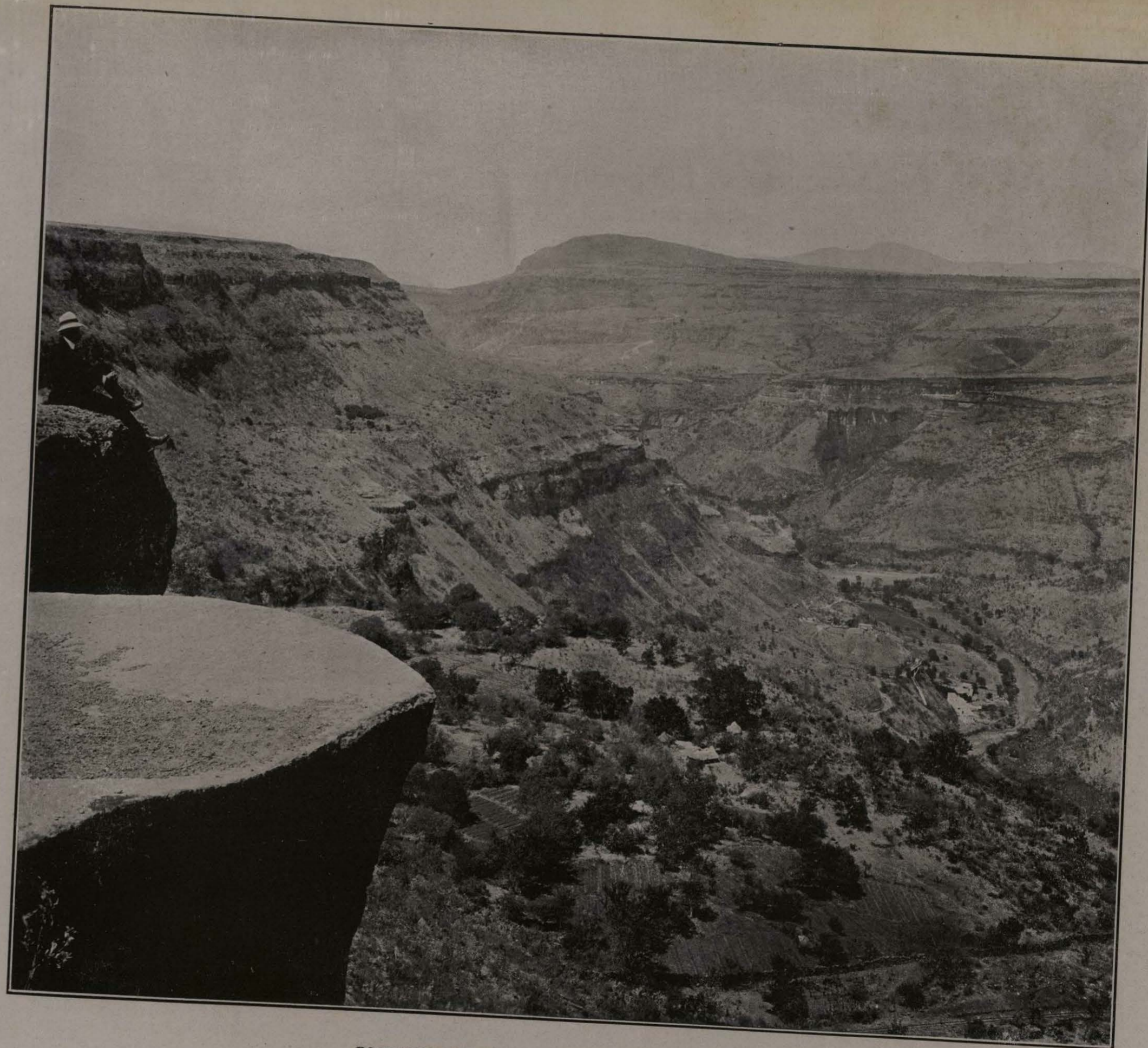
BARRANCA DE OBLATOS. GUADALAJARA, JALISCO.

Por lo demás, el templo carece de mayor interés, á no ser á título de curiosidad arquitectónica. Guadalajara tiene otras varias iglesias más modernas, y, por lo pintorescas, son dignas de visitarse las parroquias de los pueblillos inmediatos.