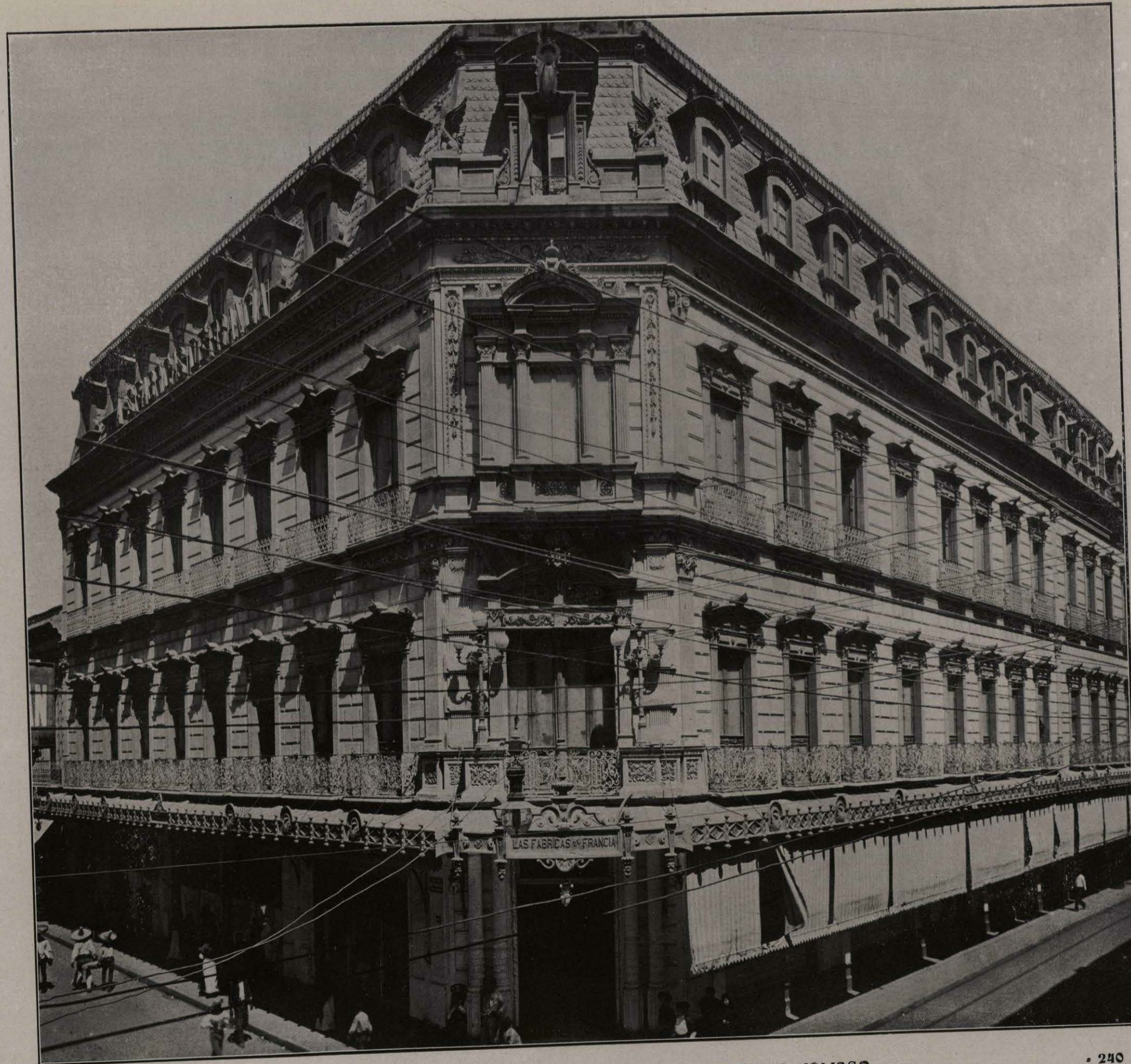
EDIFICIO DE "LAS FÁBRICAS DE FRANCIA." GUADALAJARA, JALISCO.