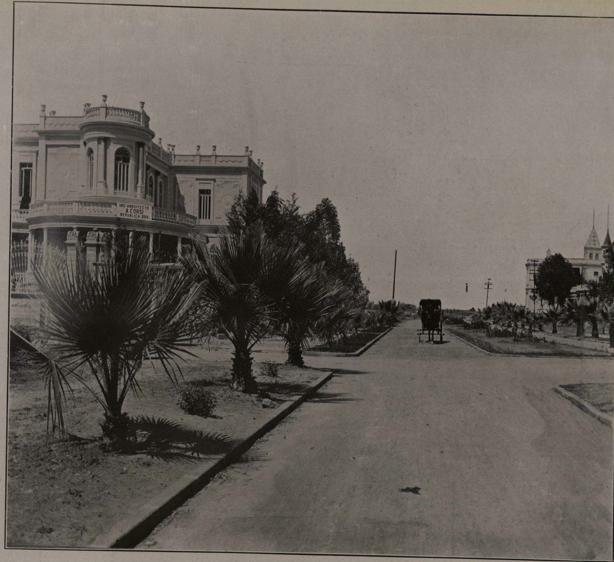
COLONIA AMERICANA. GUADALAJARA, JALISCO.