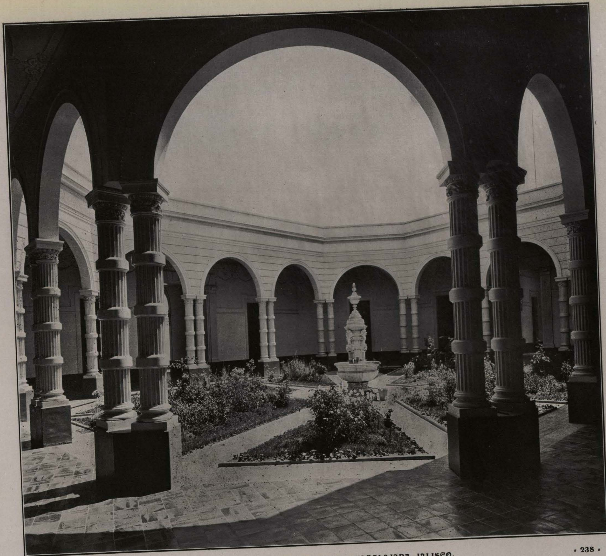
ESCUELA MODELO "MIGUEL AHUMADA. GUADALAJARA, JALISCO.