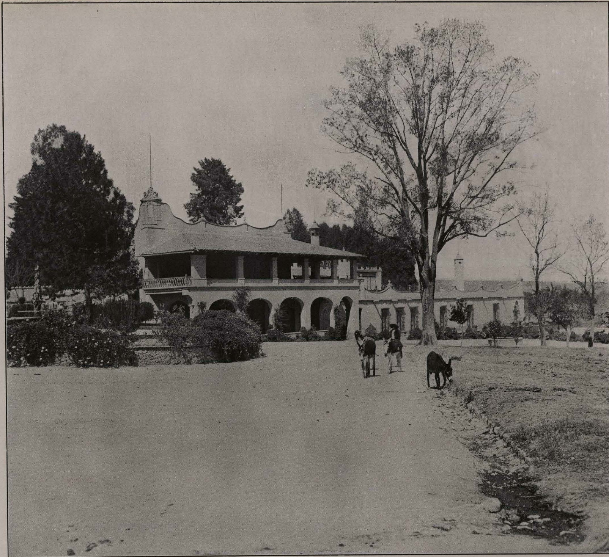
SAN ANGEL INN. DISTRITO FEDERAL.