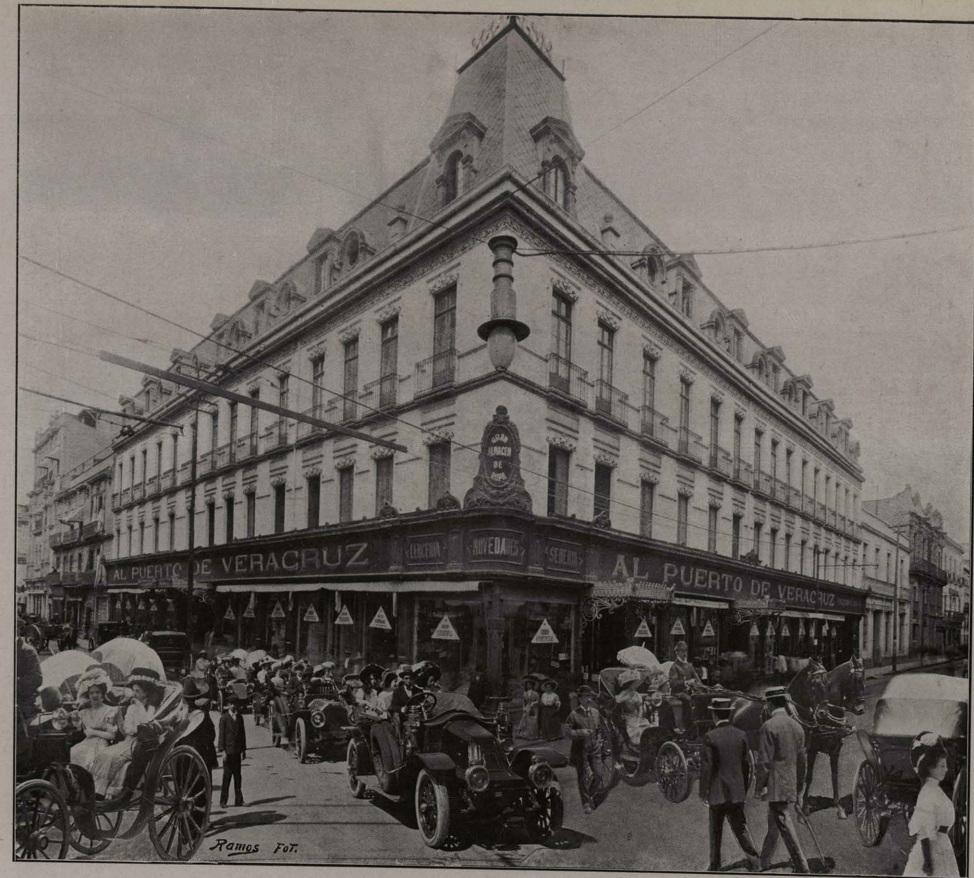
"AL PUERTO DE VERACRUZ," MÉXICO.

una transformación prodigiosa llevada á efecto por el capital y el buen gusto modernos. La antigua capilla, que sirvió alguna ocasión de oratorio á la familia habitadora de la finca, durante la estación veraniega, ha sido restaurada y resiste los estragos del tiempo, conservando cierto tinte de su arcaica fisonomía. Viejos cuadros de pálidos tonos, pinturas místicas en su mayor parte, amarillentos crucifijos de marfil aquí y allá suspendidos, parece que nos hablan de una época ya desaparecida, y la impresión se completa cuando el visitante se acomoda en aquellos suntuosos siales, en esos sillones cordobeses, de brazos primorosamente esculpidos. Y cuando hartos ya de respirar el ambiente del pasado, deseamos un hálito de naturaleza, salimos al huerto á los frescos jardines, poblados de cenadores y embalsamados por mil flores, á recrear los ojos y á embriagar todos los sentidos en esta fiesta continua de la primavera.