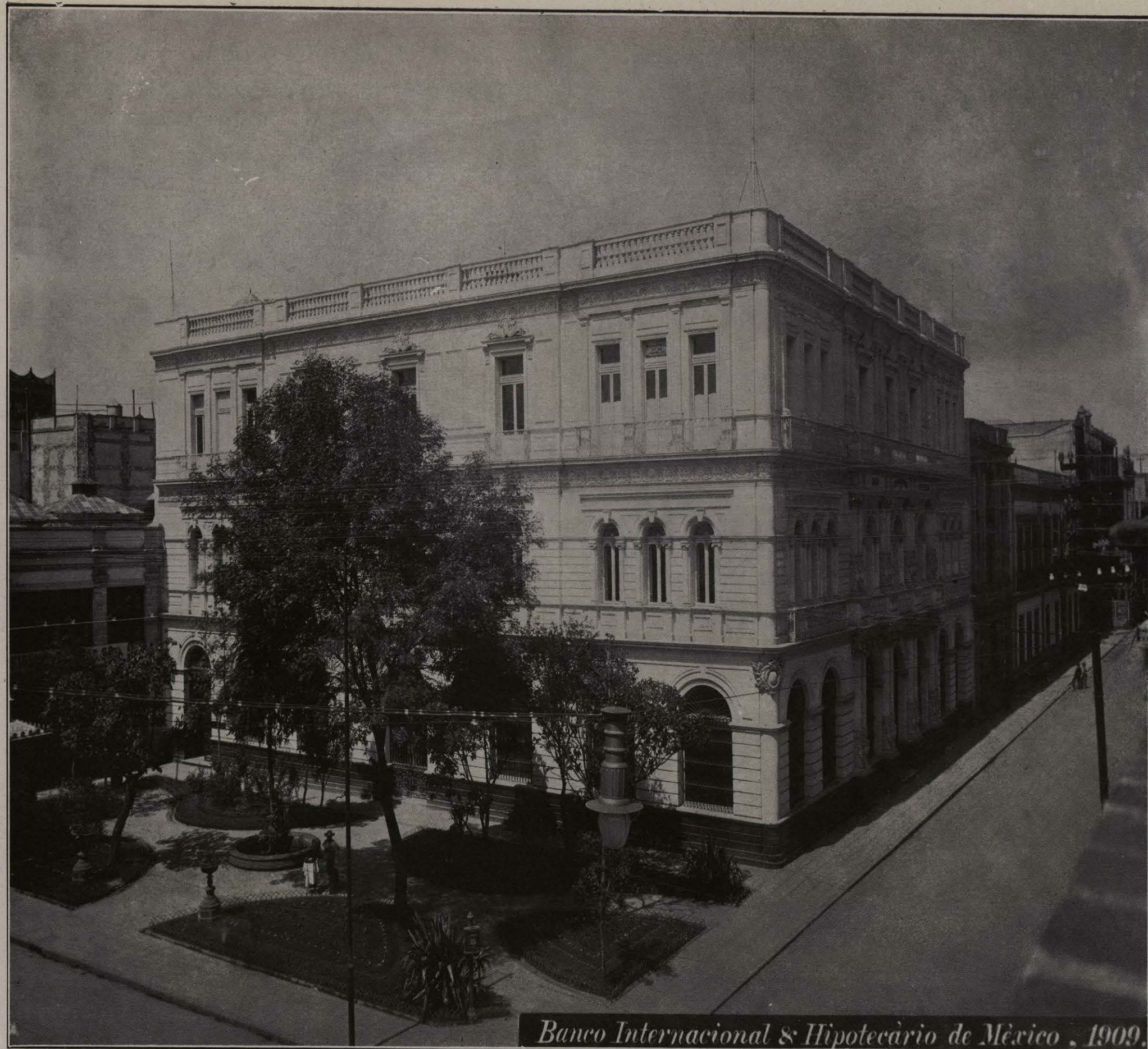
Banco Internacional e Hipotecario de México, 1909.