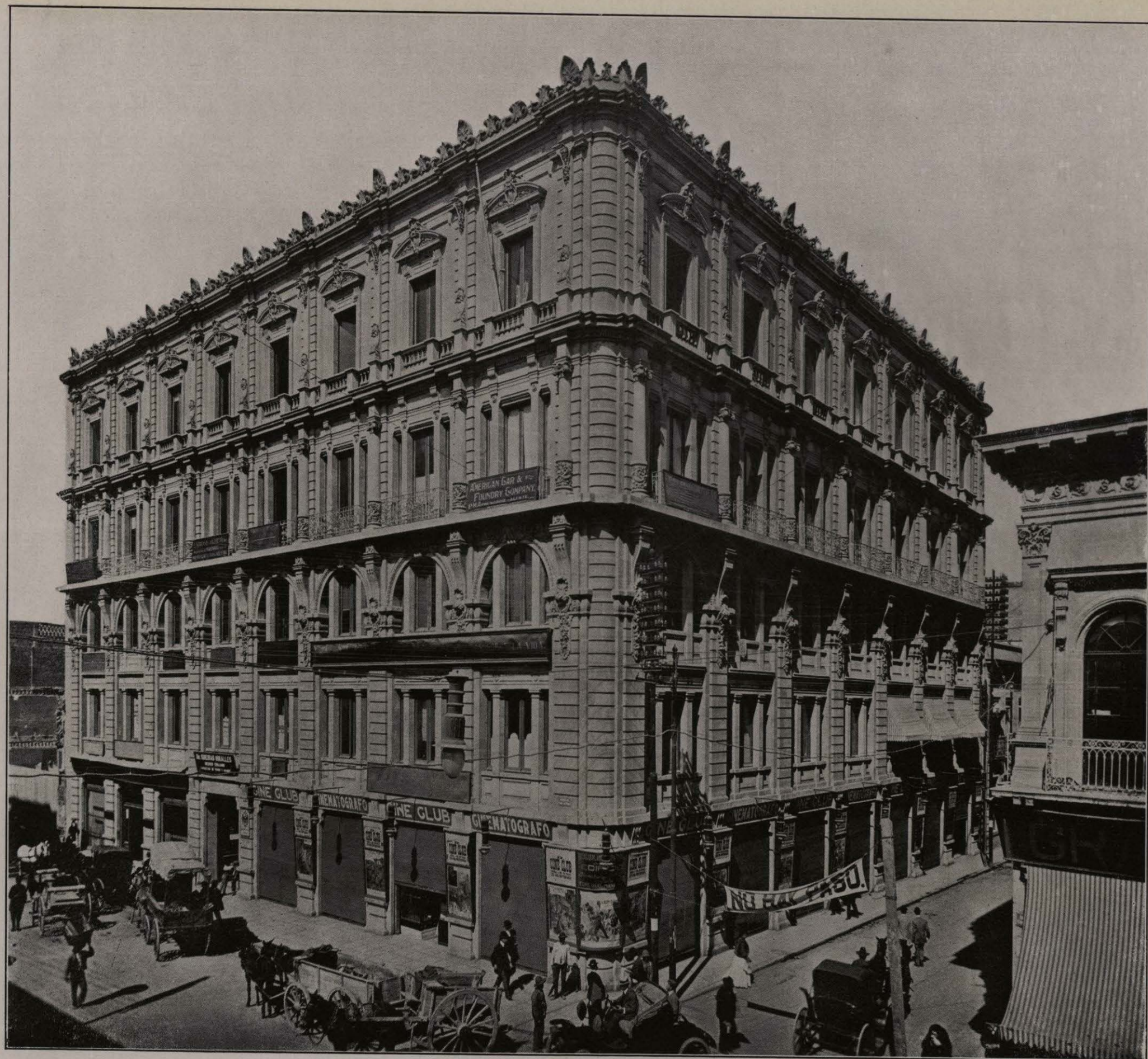
EDIFICIO DE LA COMPAÑÍA BANCARIA DE FOMENTO Y BIENES RAÍCES DE MÉXICO, S. A.