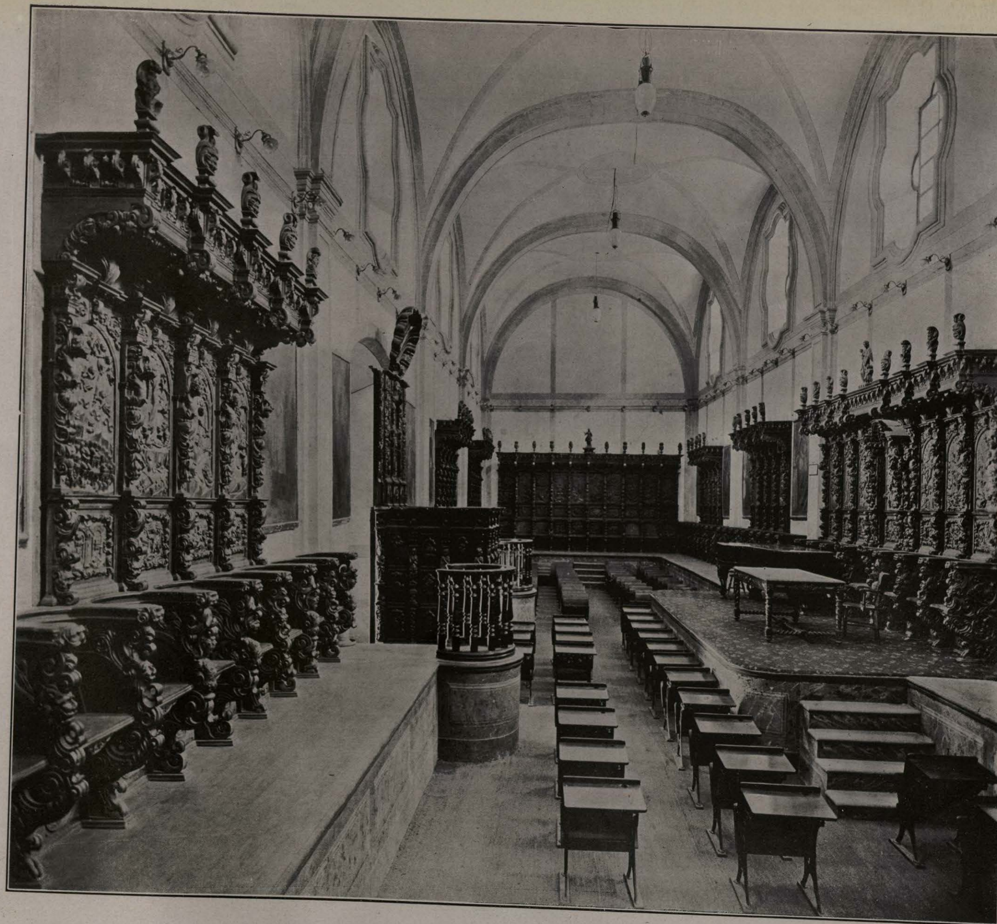
ESCUELA NACIONAL PREPARATORIA. MÉXICO. (Salón de actos).