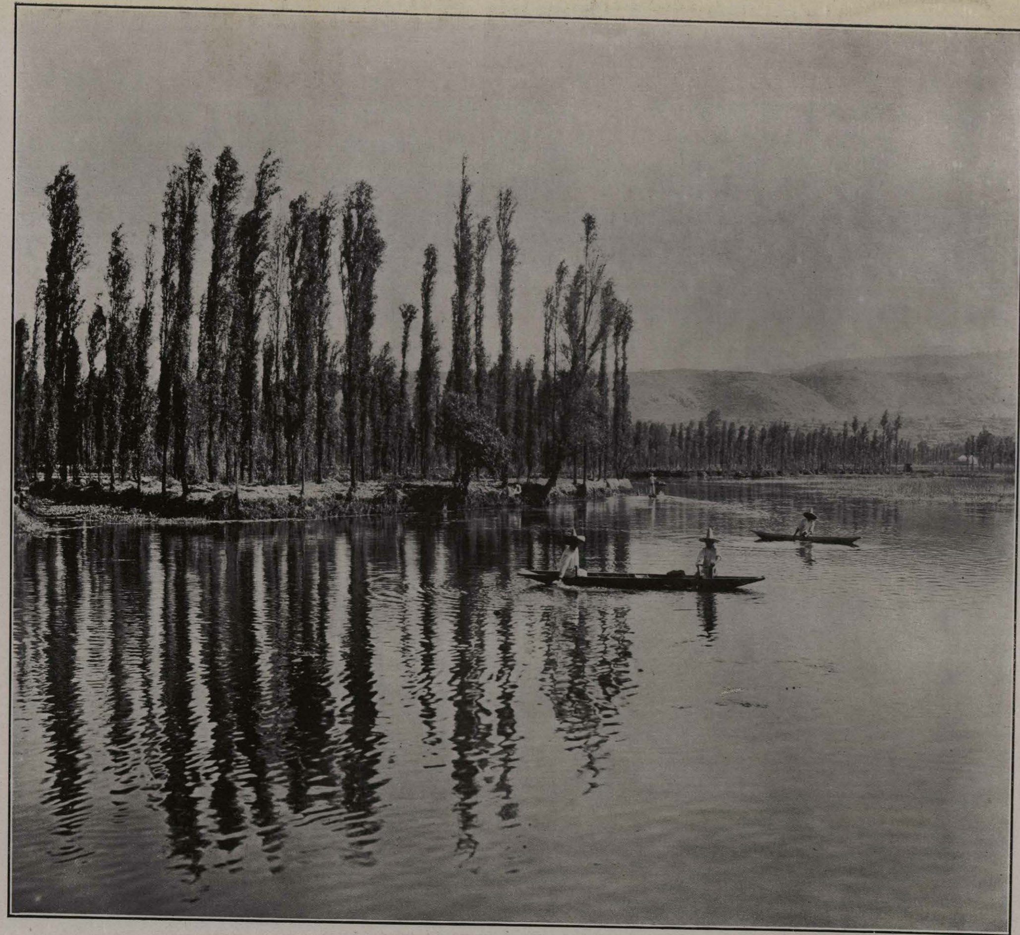
LAGO DE XOCHIMILCO. DISTRITO FEDERAL.

La belleza de los poblados y caseríos que se encuentran al Sur de la Capital mexicana, en la dirección de la erizada serranía del Ajusco, es tan notable bajo todos conceptos, que ya desde los tiempos de Cortés, aconsejaban sus compañeros al conquistador que asentase los cimientos de la nueva ciudad en Coyoacán, encantadora población del Sur del valle, donde, positivamente, se alzó la primera iglesia edificada para el culto cristiano en este contingente. Tantas atractivos ofrecen todas estas pequeñas poblaciones situadas al Sur, que