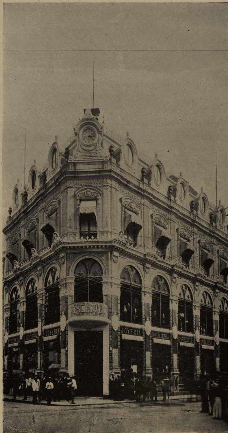
“LA ESMERALDA.” (Edificio de mármol en la esquina de Plateros y el Espíritu Santo.)

Entre las FOTOGRAFÍAS más afamadas y artísticas (las fotografías se encuentran por toda la Ciudad), se cuentan en primera línea: Valleto y Compañía (2ª de San Francisco 2), que es una de las más antiguas y favorecida por la aristocracia; Mora (2ª de San Francisco 4); Schlattman (Espíritu Santo 1); Torres Manuel (3ª de San Francisco); Waite (1ª de San Cosme 2,419). Este último tiene un magnífico surtido de vistas fotográficas de la Ciudad de México y de otros puntos de la República: compite con Briquet , cuyas COPIAS FOTOGRAFICAS DE VISTAS DE TODA LA REPÚBLICA, se hallan de venta en las casas de Pellandini (2ª de San Francisco) y Calpini (Esquina de la 2ª de San Francisco y Callejón del Espíritu San-