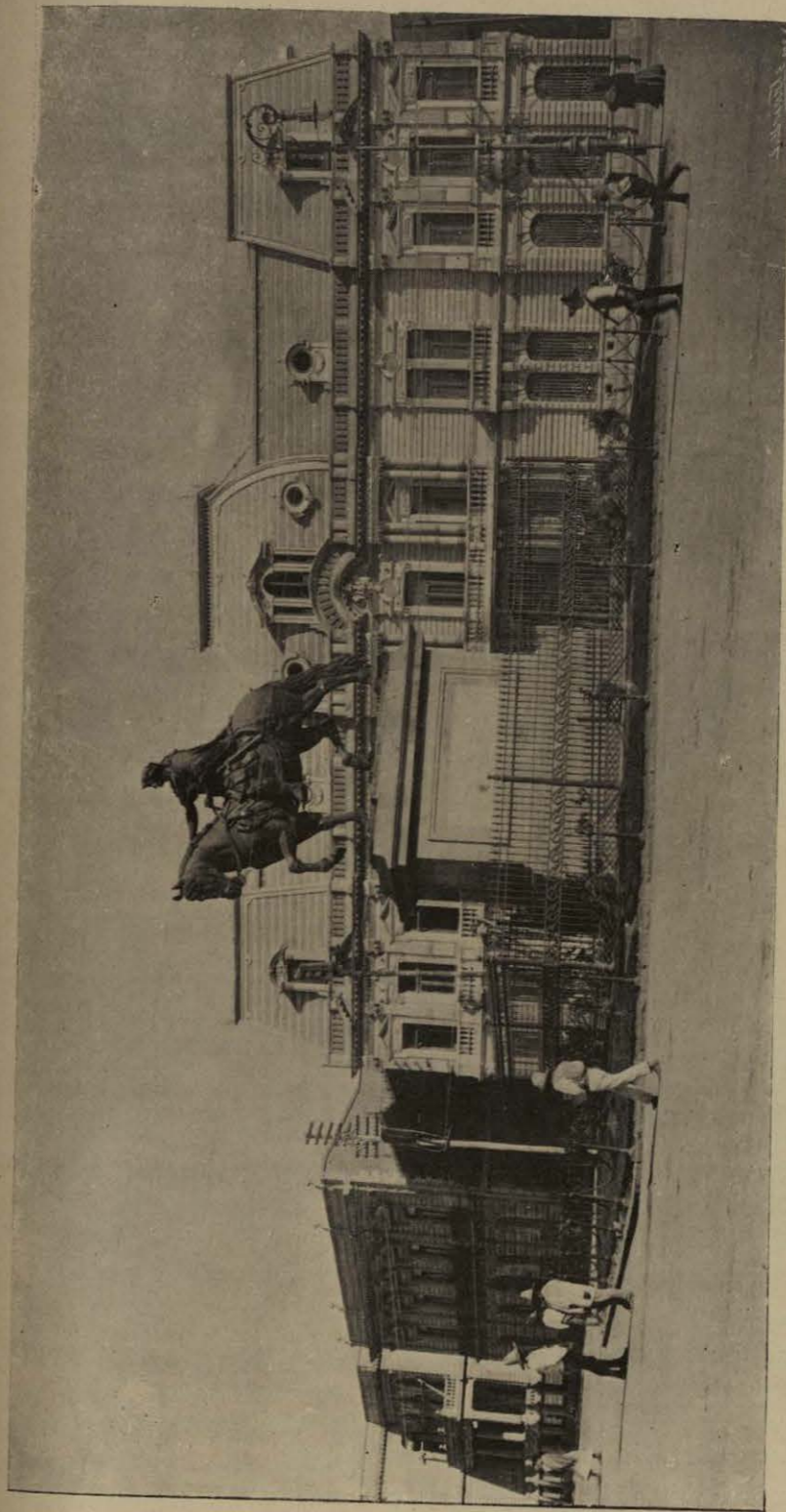
ESTATUA ECUESTRE DE CARLOS IV.