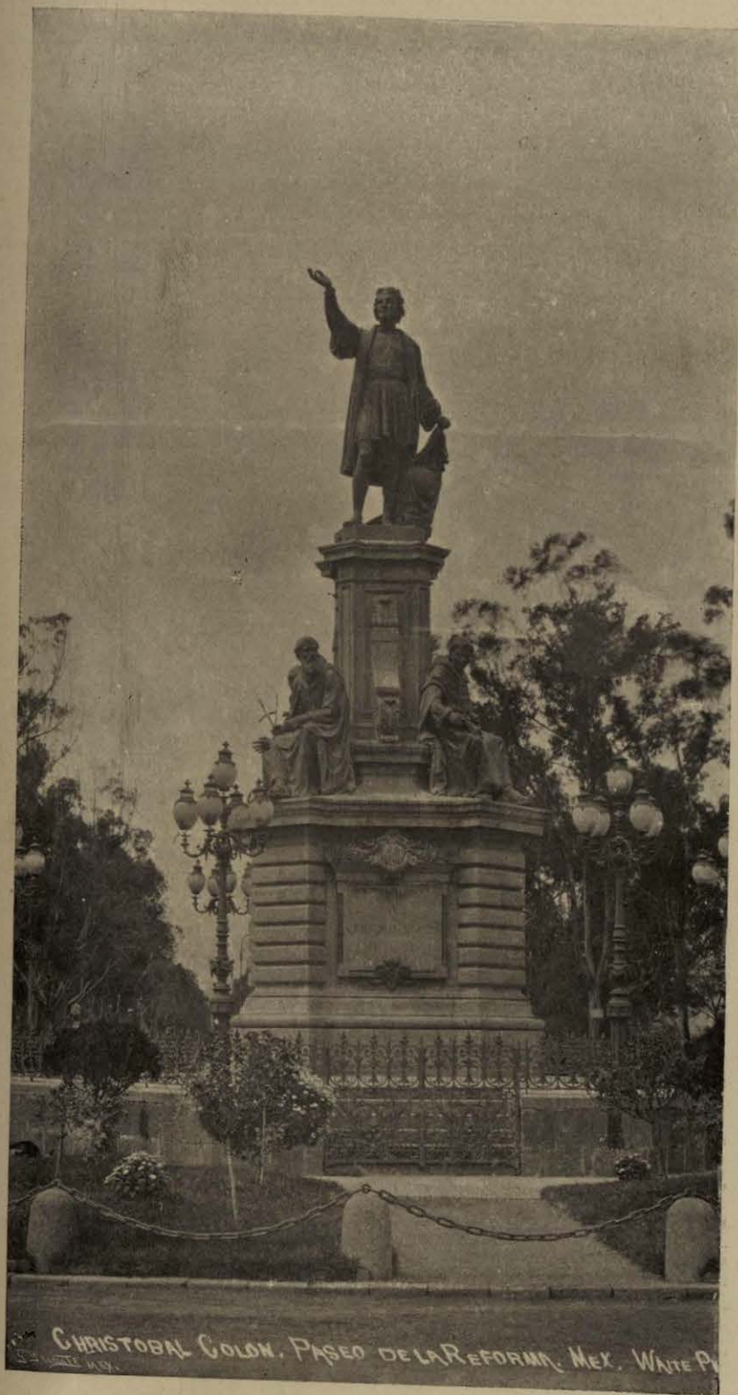
CHRISTOBAL COLON. PASEO DE LA REFORMA, MEX. WHITE P